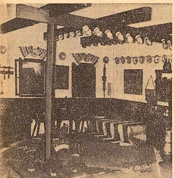
Standul turistic românesc la Tîrgul internațional de la Viena