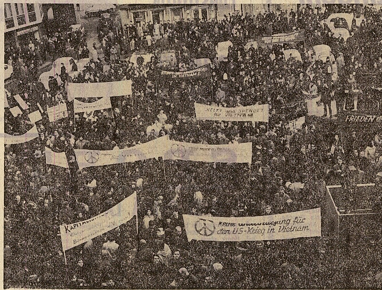
Zilele trecute, la Frankfurt (R. F. a Germaniei) a avut loc o puternică demonstrație de protest împotriva războiului dus de S.U.A. în Vietnam