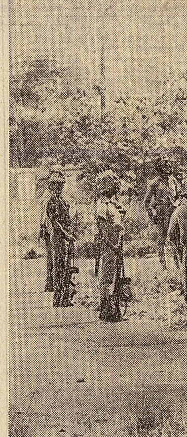
În Nigeria continuă luptele între forțele guvernului central și cele ale provinciei secesioniste Biafra. În fotografie: soldați din armata guvernamentală în apropiere de orașul Nsukka

Cu acest prilej, a avut loc o convorbire cordială privind dezvoltarea relațiilor dintre cele două țări.