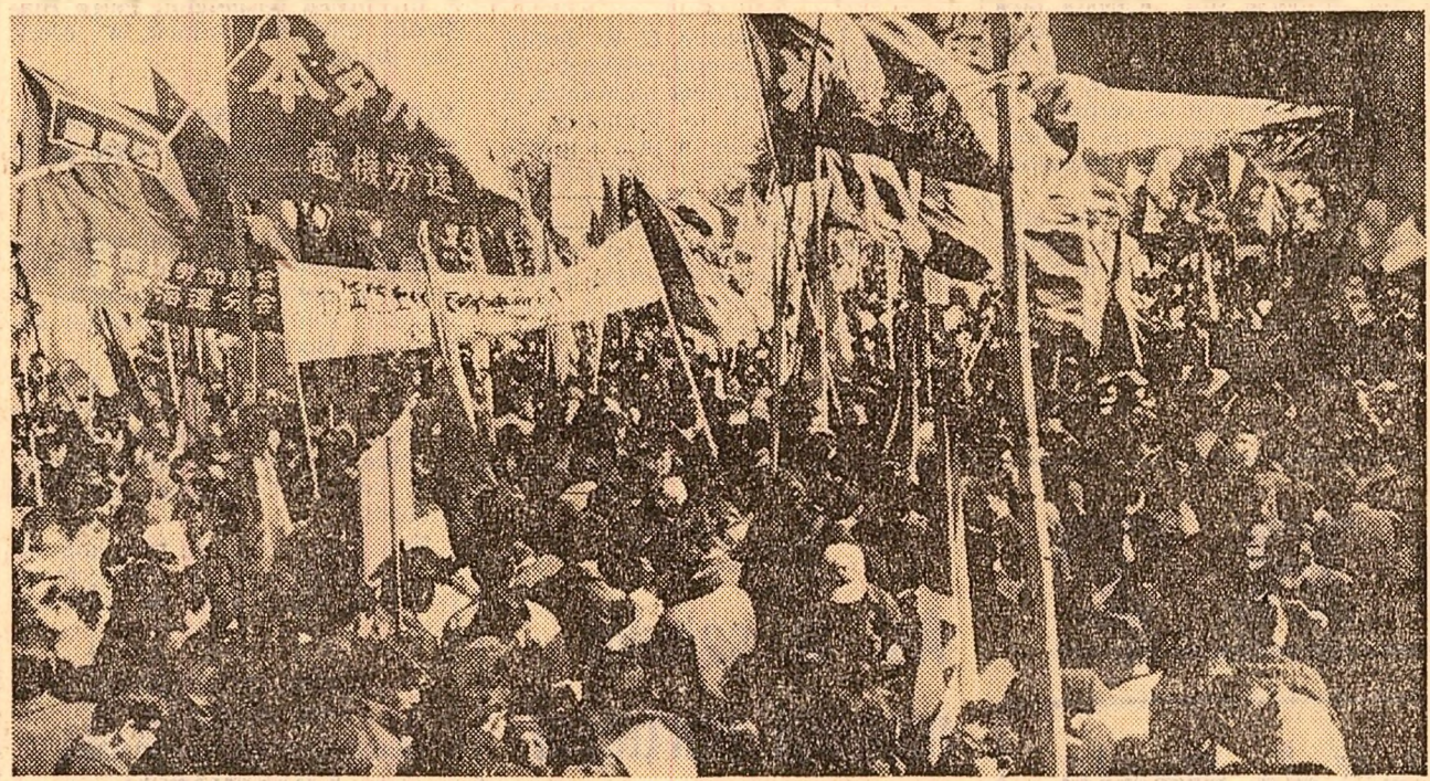
În Japonia, au avut loc largi acțiuni revendicative ale muncitorilor pentru majorarea salariilor și împotriva creșterii prețurilor. În fotografie: aspect de la demonstrația din Tokio

Comentând aceste dezbateri, influenta publicație americană „New York Times” caracterizează declarațiile lui Dean Rusk ca „făcând impresia unei plăci foarte uzate”. „Oare citi și pot permite Statele Unite să continue calea escaladării în acest război nepopular și inutil pentru a apăra niște principii nefondate?”, conchide ziarul.