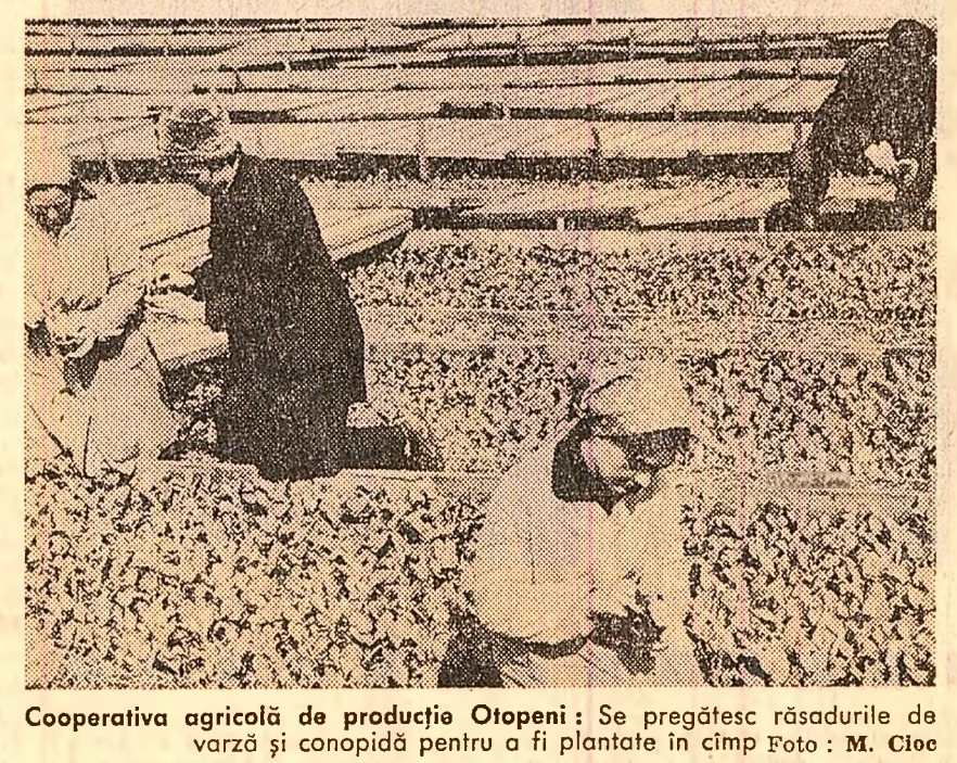
Cooperativa agricolă de producție Otopeni: Se pregătesc răsădurile de varză și conopidă pentru a fi plantate în cîmp