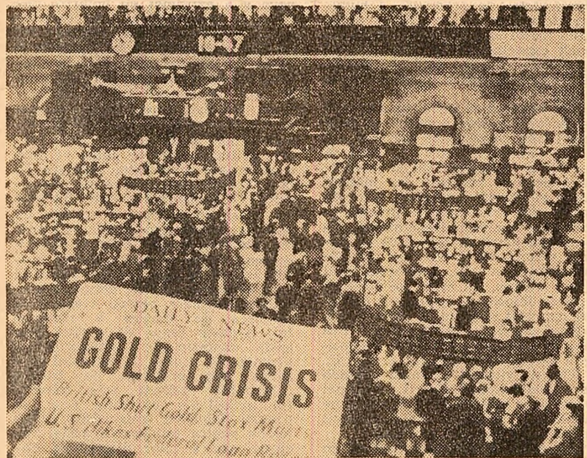
15 martie... Momente de extremă tensiune la bursa din New York

„Febra aurului”, care a atins apogeul la 14 martie, continuă să concentreze întreaga atenție a cercurilor de afaceri și politice occidentale.