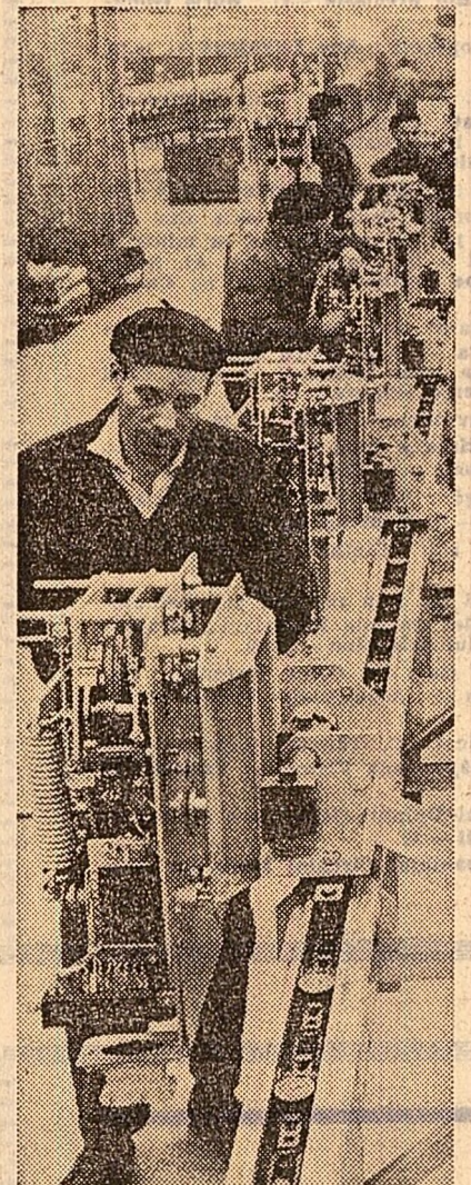
Linie de montaj pentru intrerupători de 15-20 kV, la uzinele "Electropultere" - Cricova

această trebuie să fie concentrată în întreprinderi mari, pe podgorii și specializate. Valorificarea să fie făcută de producătorii, care să participe direct la câștig și pierdere.