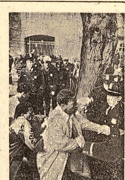
La Washington, un grup de negri, cetățeni ai S.U.A., manifestează în fața ambasadei R.S.A. împotriva apartheidului.

ceastă problemă este guvernul ce acționează prin intermediul autorităților polițienești.” „La fel de periculos, arată ziarul de constituție, care se referă la constituirea ziarelor și publicațiilor, în cazul în care s-ar constata că prin conținutul articolelor lor „s-ar jigni onoarea” persoanelor ce ocupă sau ocupat funcții oficiale în stat.” Presa ateniană a anunțat că proiectul de constituție vor trebui înaintate pînă la data de 30 mai unei comisii numite de guvern.