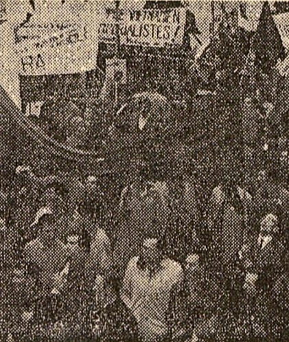
O manifestație de solidaritate cu poporul vietnamez, pe străzile Parisului.

MONTREAL 22 (Agerpres). — La 22 martie a avut loc la Montreal semnarea primului acord comercial între Republica Socialistă România și Canada. Conform prevederilor acestuia, părțile își acordă reciproc clauza națiunii celei mai favorizate, creîndu-se astfel condiții mai bune extinderii schimburilor comerciale între cele două țări. Acordul a fost semnat din partea canadienă de Robert Winters, ministrul comerțului și comerțului exterior, iar din partea română de Vasile Răuț, adjunct al ministrului comerțului exterior.