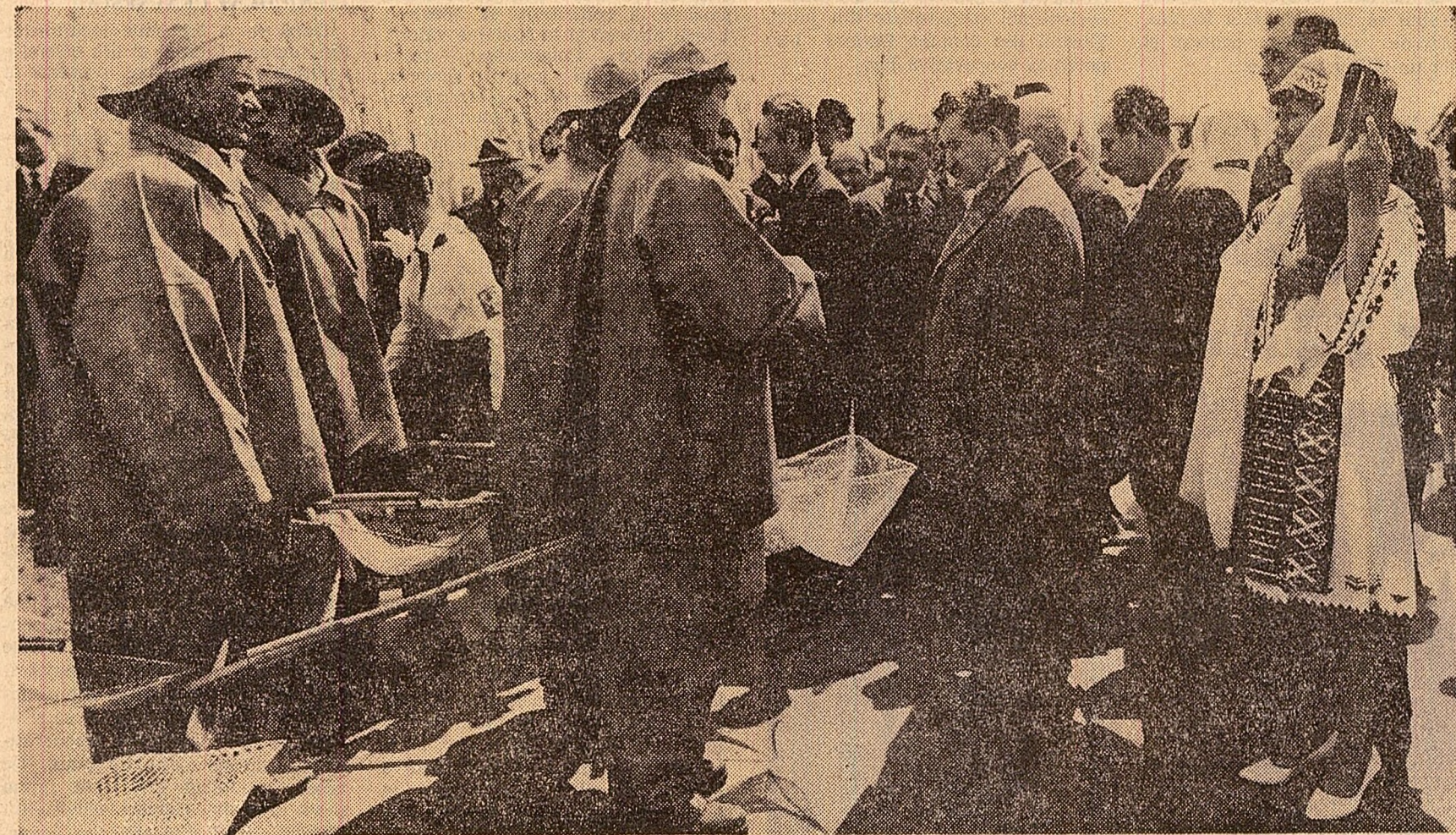
Conducătorii de partid și de stat sînt înfîpinați și de reprezentanții pescarilor din Delta

Îmbarcați pe nava „Republica”, oaspeții s-au îndreptat spre celălalt obiectiv industrial — Marele depozit frigorific, o unitate modernă dată în folosință anul trecut, ca