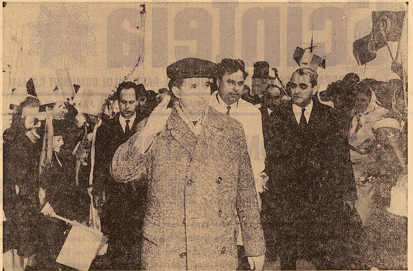
În timpul vizitei la depozitul frigorific din Tulcea

În repetate rînduri cuvîntarea secretarului general al C.C. al P.C.R. a fost subliniată cu vil și însuflețite aplauze.