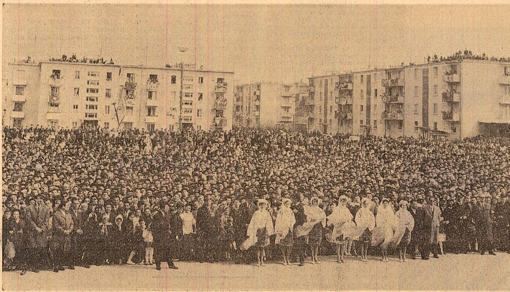
La mitingul din orașul Tulcea

— Ați obținut beneficii — remarcă tovarășul Nicolae Ceaușescu — dar nu pe măsura posibilităților. De ce unii indicatori economici pe 1968, față de 1967, scad în loc să crească. Cum este posibil ca