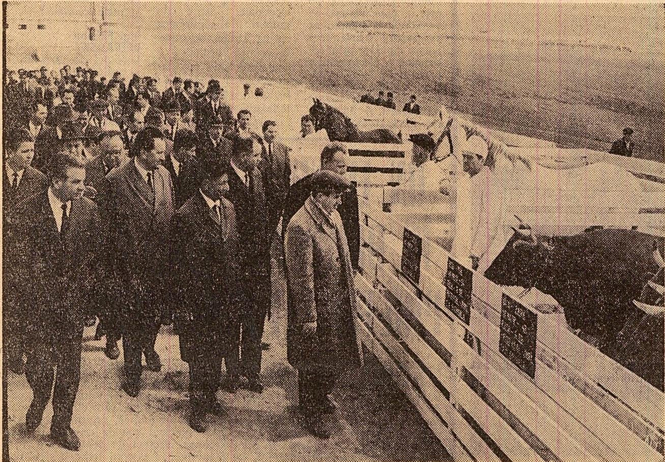
Expoziția realizărilor agriculturii cooperatiste din județul Tulcea, organizată la Cataloi

Permit cu îndelungi urale și ovății, a luat cuvîntul tovarășul NICOLAE CEAUȘESCU.