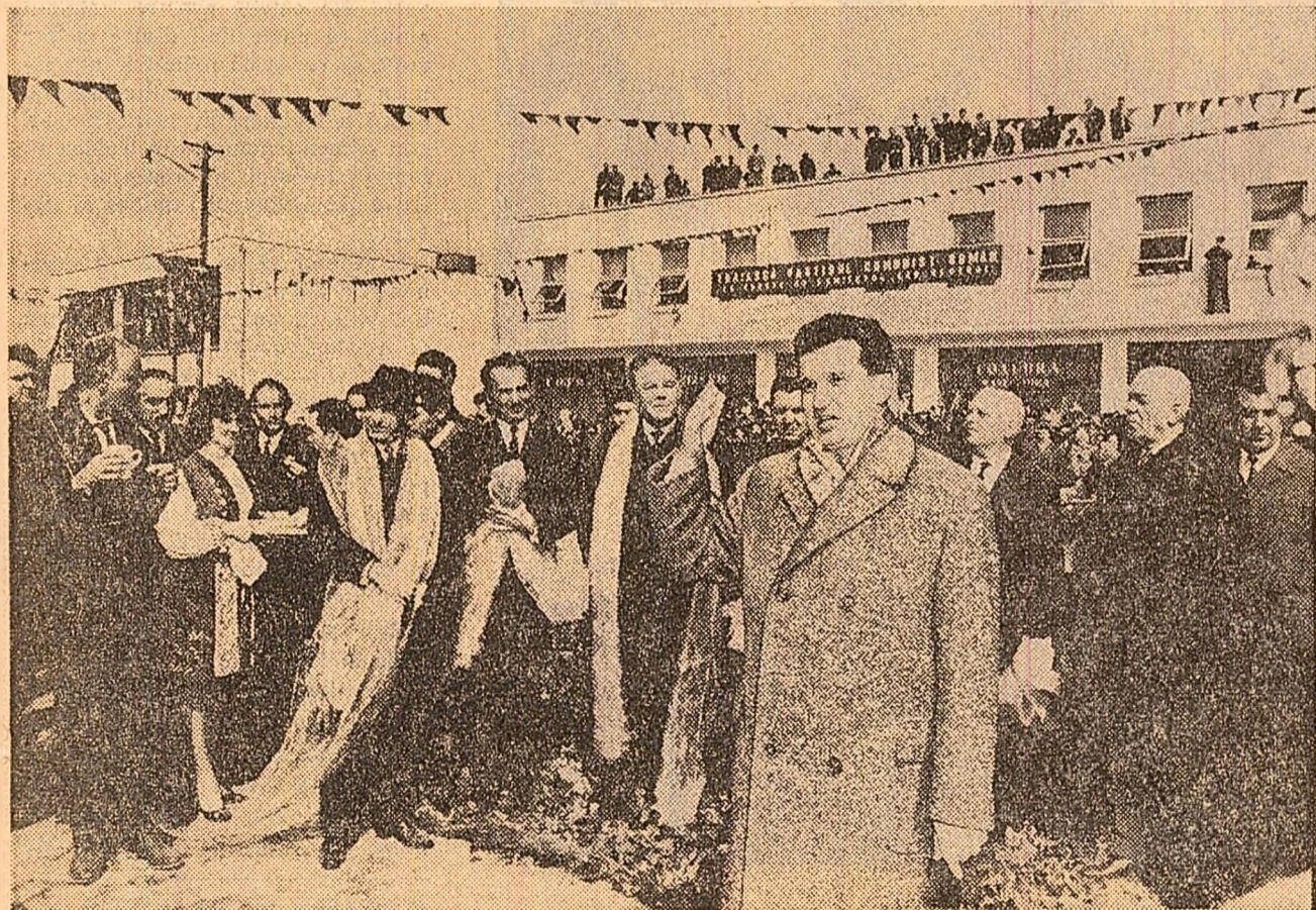
Conducătorii de partid și de stat sînt înfîpnați la Babadag după datina locală

Superioară, guvernele celor două țări au hotărît să stabilească relații diplomatice la rang de ambasada.