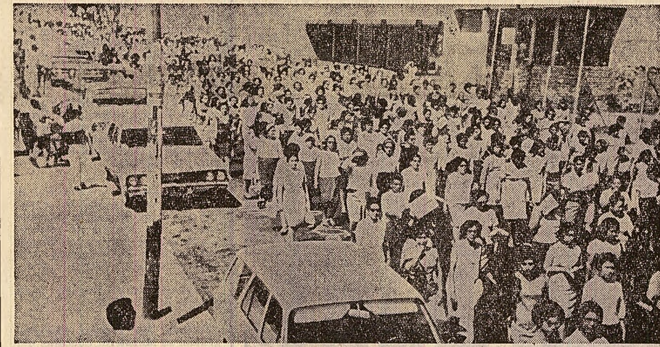
La San-Salvador, capitala Salvadorului, a avut loc o impresionantă demonstrație a profesorilor și studenților. Ei cereau reprimirea la lucru a profesorilor ilegal concediați și plata salariilor neachitate. În foto: coloanele de manifestații în fața parlamentului.

Dacă Washingtonul se crampoanează de acest bloc și încearcă să-l prelungească existența, o face nu pe motive de apărare împotriva vreunui „pericol din răsărit”, în care el însuși nu crede, ci pentru a-și întări dominația asupra partenerilor vest-europeni, a nu-l lăsa să scape de sub control și pentru a frîna tendințele centrifuge din sinul acestei organizații. N.A.T.O. — principalul instrument al variantelor moderne a obscurantismului medieval — războiul rece. Cu înfrînerea sa sînt înfrînute: neîncrederea, suspiciunea, nestînjențarea și înarmările, menținerea unui climat propice focarelor de tensiune în Europa sau în altă parte a globului.