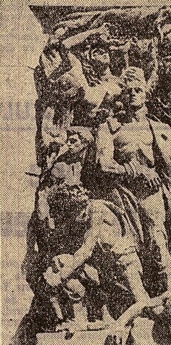
Fragment din monumentul ridicat la Varșovia în memoria răscolii din ghetou.

ceștia au ales însă calea luptei, ridicându-se cu arma în mână împotriva călătorilor lor. Răscoala a izbucnit la 19 aprilie 1943. În zorii acestei zile nazistii au încercat să aducă la îndeplinire ordinul căpătenilor lor de a-i deporta și extermina pe ultimii supraviețuitori și de a lichida definitiv ghetoul.