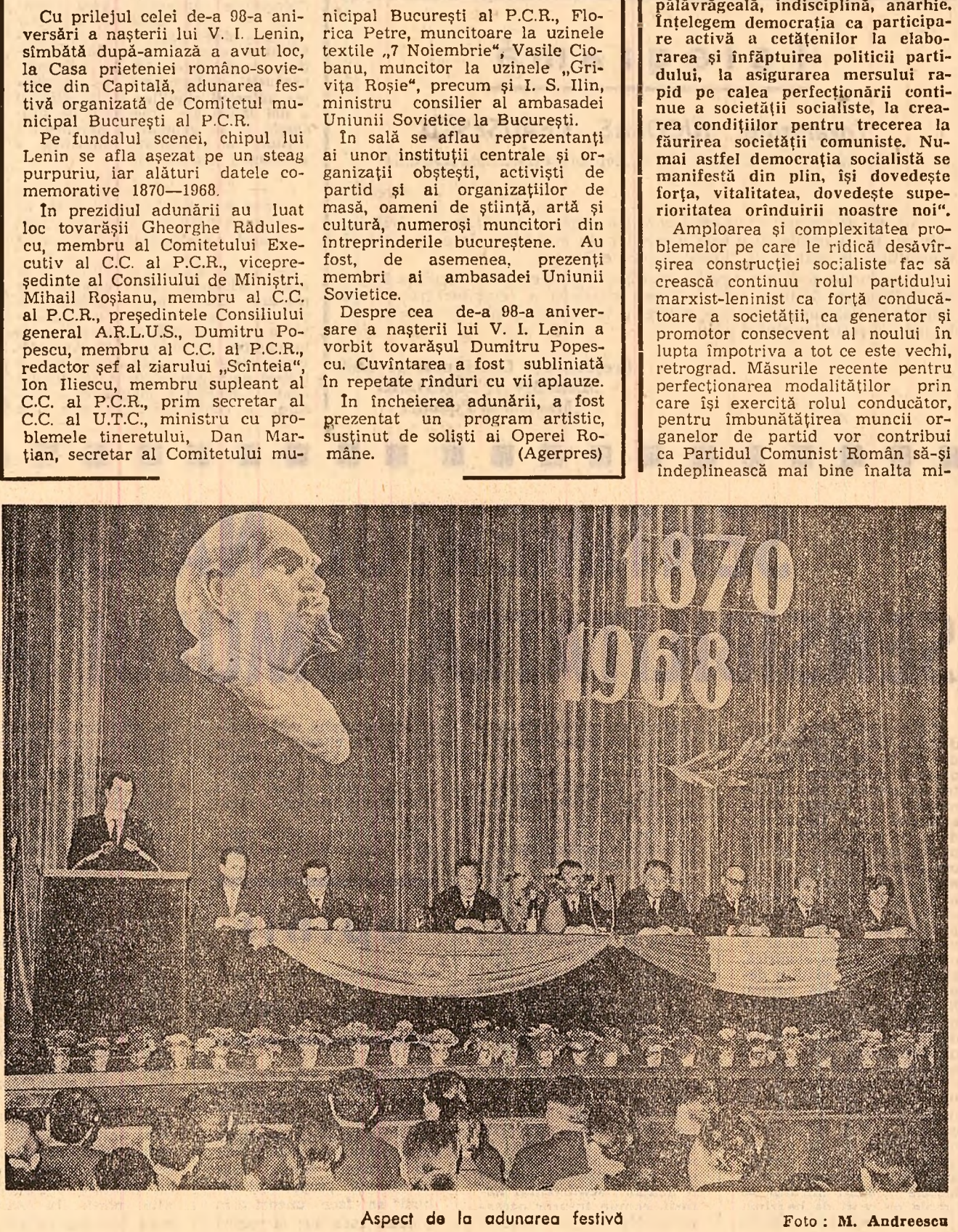
Aspect de la adunarea festivă