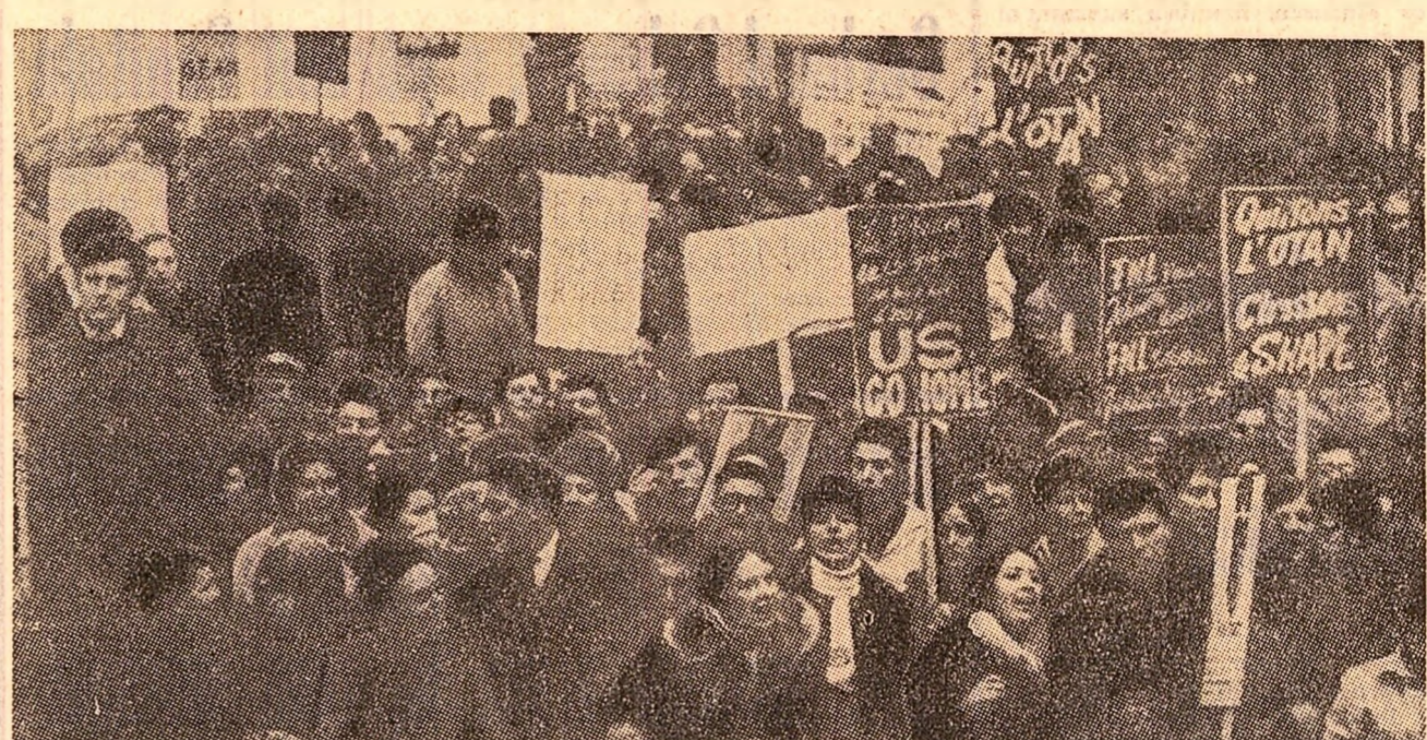
„Să părăsim N.A.T.O.”, „Afară cu SHAPE” (Comandamentul N.A.T.O., instalat în Belgia, după ce a trebuit să părăsească Parisul): cererile demonstrațiilor la o recentă manifestație a populației din Bruxelles