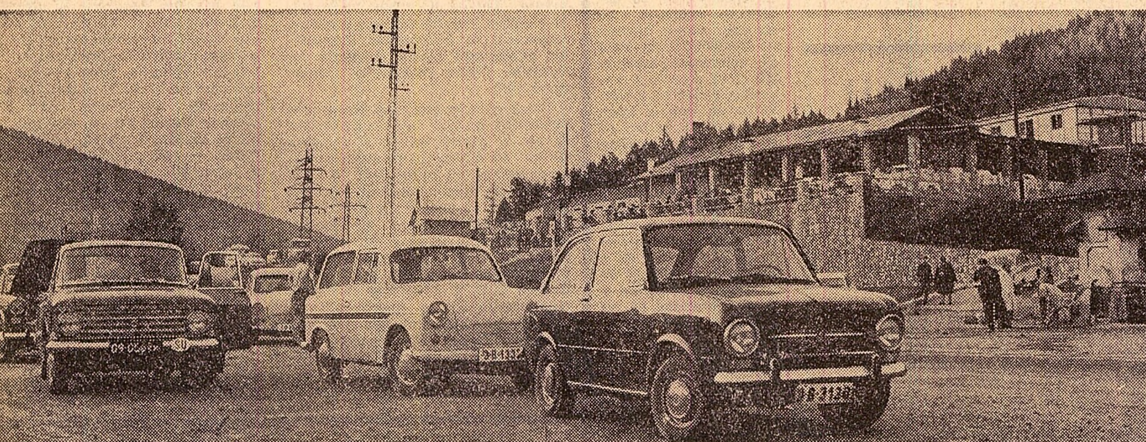
Popas la Izvorul rece, lîngă Sîncia

Orașul Zalău a fost vizitat zilele acestea de o formație folclorică maramureșeană. Programul bun, interesant, a fost însă alterat din pricina lipsei de organizare. În casa de cultură, unde a avut loc spectacolul, publicul a depășit cu mult capacitatea sălii și a continuat să intre în tot timpul reprezentației. Gălăgia a diminuat evident efectul spectacolului. Unii cetățeni ai orașului ne-au spus că acest obicei se practică și cu alte ocazii și că ar fi bine să se pună ordine în această privință.