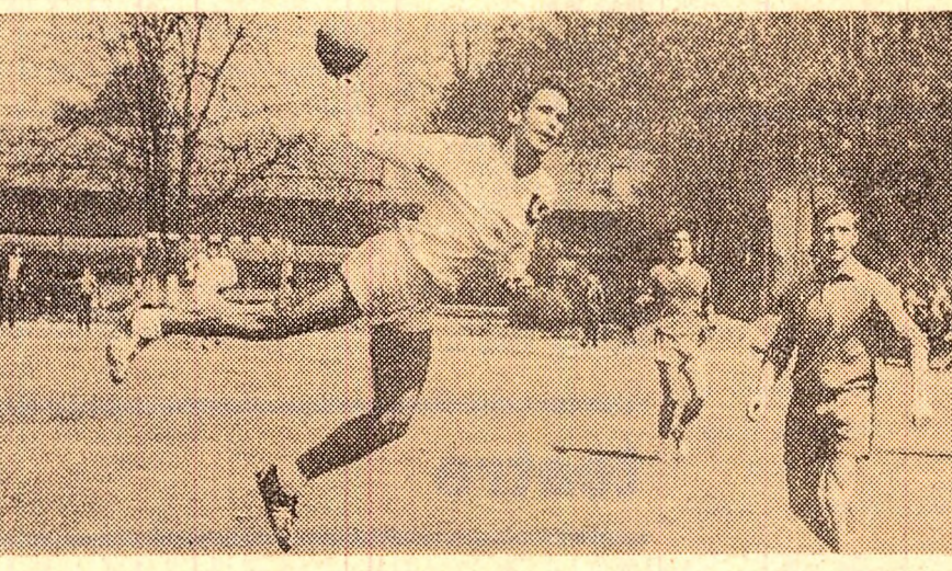
O imagine simbol pentru dezvoltarea cu care au jucat handbaliștii clujești în meciul lor cu Dinamo București

● ION ȚIRIAC - INVINGĂTOR ÎN SERIE, ÎN CONCURSURILE DIN ITALIA ● RECORD MONDIAL EGALAT LA 100 M PLAT ● SUEZIA (MASCULIN) PENTRU A TREIA OARĂ CONSECUTIV CAMPIONĂ EUROPEANĂ LA TENIS DE MASĂ ● FRUMOASA COMPORTARE A HANDBALIȘTILOR DE LA UNIVERSITATEA CLUJ, LA BUCUREȘTI ● CAMPIONATUL DIVIZIEI A. LA FOTBAL, CONTINUĂ ÎN STILUL SAU PROPRIU ● ALTE ȘTIRI DIN ȚĂRA ȘI DE PESTE HOTARE.