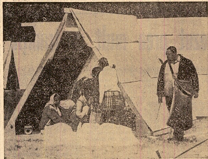
„Orșelul” ridicat la Washington de participanții la „Marșul săracilor”

ropa și în întreaga lume. Se subliniază faptul că în domeniul politicii externe declarația consideră că este necesar ca între națiunile europene să se dezvolte relații în toate domeniile, care vor deschide calea unei cooperări în întreaga Europă. Săptămânalul redă, de asemenea, pasajele privind problema vietnameză și situația din Orientul Mijlociu.