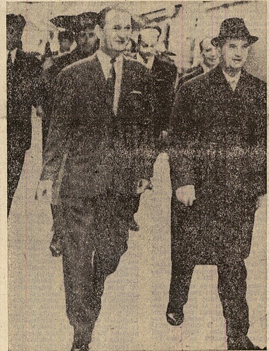
În orașul Dubrovnik

Jakov Blajevici, președintele Skupștinei R.S. Croația, a oferit la Hotelul Excelsior un dejun în cinstea tovarășului Nicolae Ceaușescu și a soției sale. Au participat membrii delegației române, persoanele oficiale iugoslave care o însoțesc, precum și conducătorii ai organelor locale de partid și de stat.