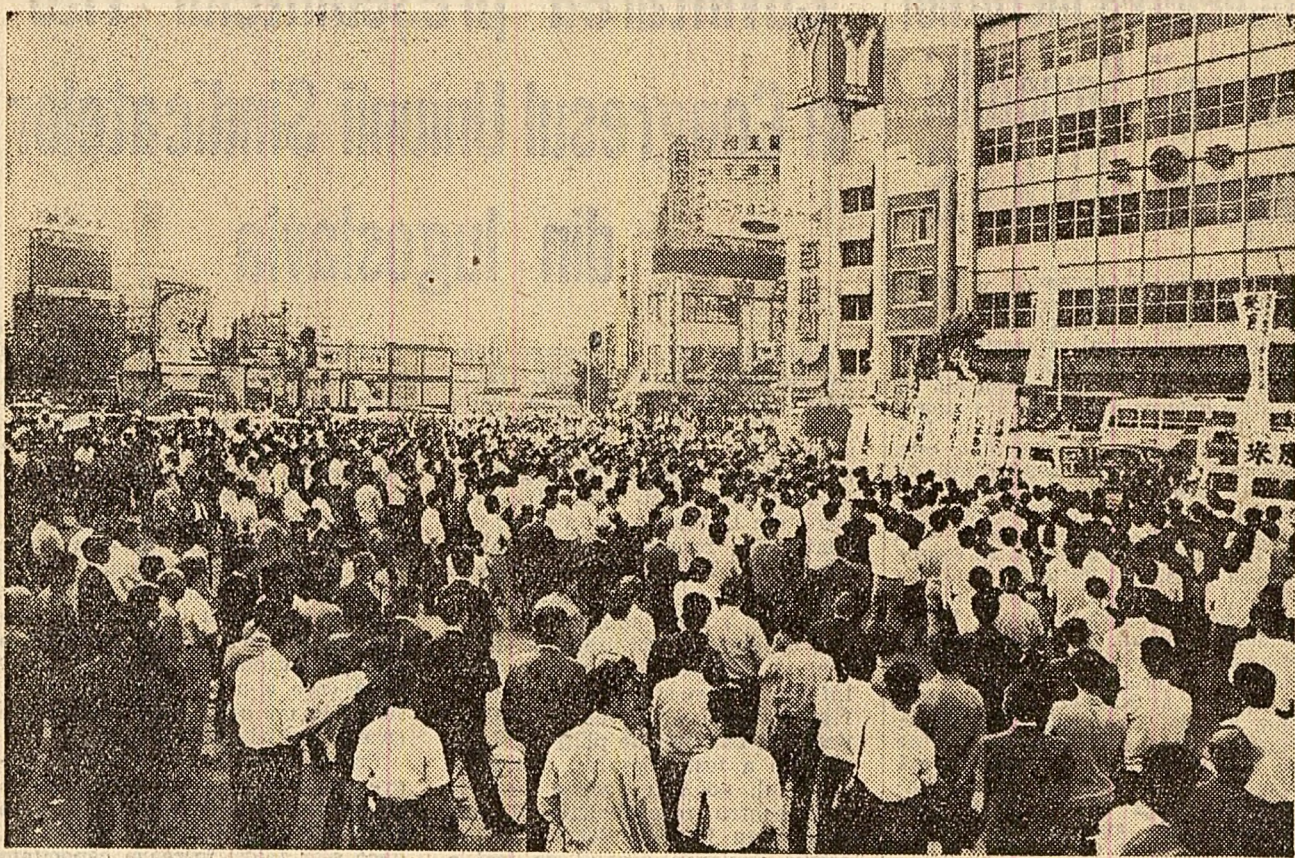
În Japonia este în plină desfășurare campania electorală în vederea alegerilor parțiale din luna iulie pentru Camera superioară a parlamentului. În fotografia: Miting electoral convocat de Partidul Comunist din Japonia la Tokio