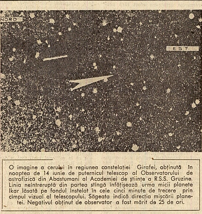
O imagine a cerului în regiunea constelației Girafei, obținută în noaptea de 14 iunie de puternicul telescop al Observatorului de astrofizică din Abastumani al Academiei de științe a R.S.S. Gruzine. Linia neîntreruptă din partea stîngă înfățișează urma micii planete Ikar lăsată pe fondul instelat în cele cîinci minute de trecere prin câmpul vizual al telescopului. Săgeata indică direcția mișcării planetei. Negativul obținut de observator a fost marcat de 25 de ori.

Un grup de savanți englezi au adresat premierului Wilson o scrisoare în care protestează împotriva cercetărilor care se fac în laboratoarele din Porton în domeniul armelor chimice și bacteriologice. Scrișoarea este semnată de 21 de savanți, între care mai mulți laureați ai premiului Nobel.