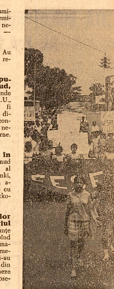
GUAYAQUIL (Ecuador). O demonstrație a elevilor și părinților în sprijinul cererilor de sporire a alocațiilor pentru învățămînt și a deschiderii de noi școli