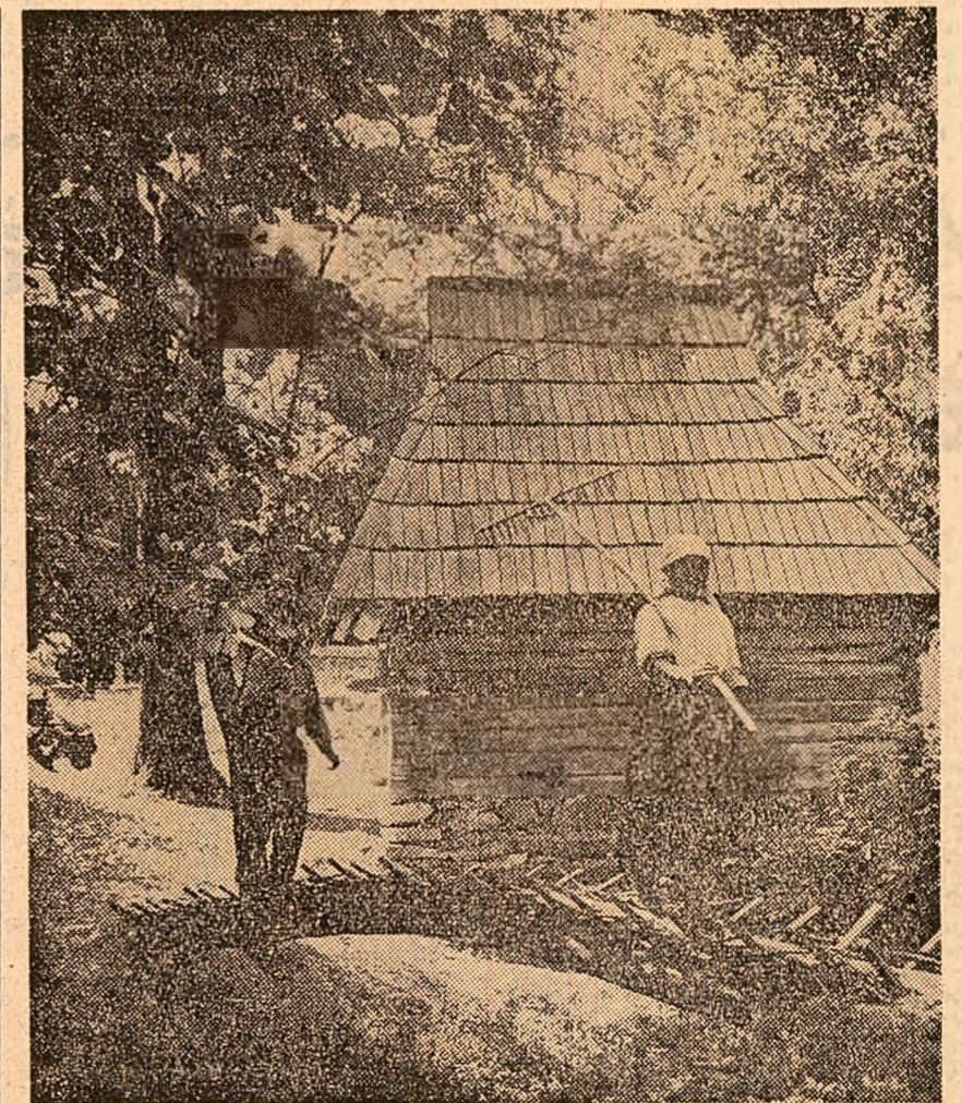
Dumbrava Sibiului găzduiește — pe o suprafață de 42 ha — o expoziție în aer liber, ilustrînd genul tehnic și îndemnarea creatorilor populari de pe meleagurile românești. Acest Muzeu al tehnicii populare, ațiat în curs de îmbogățire cu noi piese, include străvechi instalații și unelte de muncă, imaginate și folosite de locuitorii din diferite ținuturi ale țării noastre.

Pornită cu convingere și hărnicie pe drumul dezvoltării construcției socialiste, țara noastră pretuiesc și răsplătește aptitudinile și talentele fructificabile cu rivnă și entuziasm de tineret.