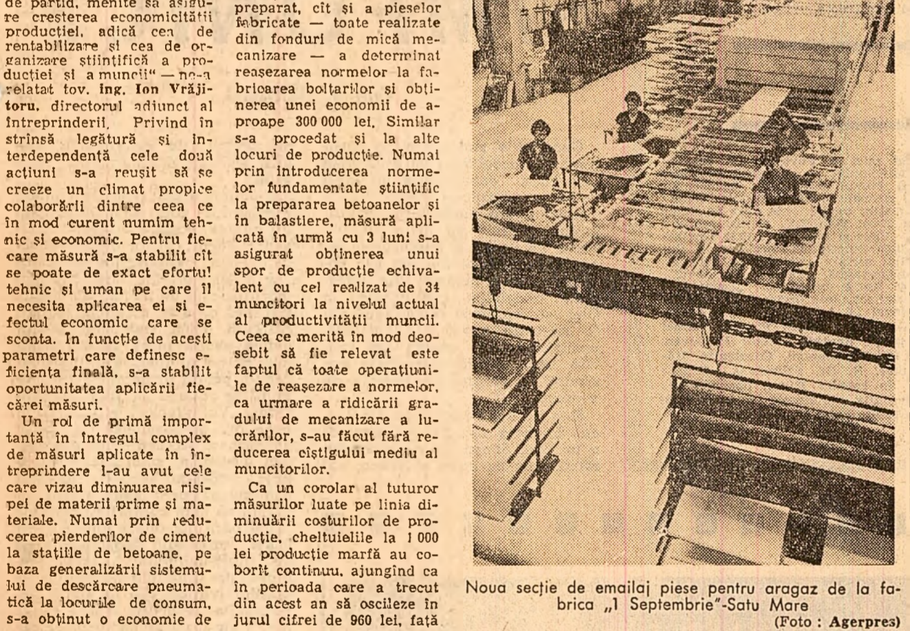
Noua secție de emailaj piese pentru aragaz de la fabrica „Septembrie”-Satu Mare

Perseverință în direcția descoperirii și valorificării noi resurse interne, capabile să dinamizeze în continuare întreaga activitate a întreprinderii, colectivul de aici lei îndreaptă în prezent atenția spre modernizarea tuturor sectoarelor de producție și sporirea capacității productive, spre perfecționarea diferitelor activități ale activității de conducere și organizare. Toate aceste preocupări, concretizate decadalmente în studii și măsuri, sînt o dovadă elocventă a hotărîrii cu care întregul colectiv s-a angajat de a urca noi treptele drumului maturizării economice, acum la aniversarea unui deceniu de la înființarea întreprinderii.