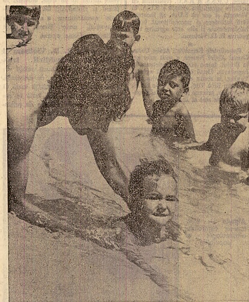
Ştrandul Tineretului din Capitală: Primele nojuni de înot

ECHIPA VEST-GERMANĂ DE FOTBAL AACHEN şi-a continuat turneul în Argentina jucând la Mar del Plata cu echipa Boca Juniors. Gazdele au reuşit victoria cu scorul de 2-1. Jocul a fost urmărit de peste 25.000 de spectatori.