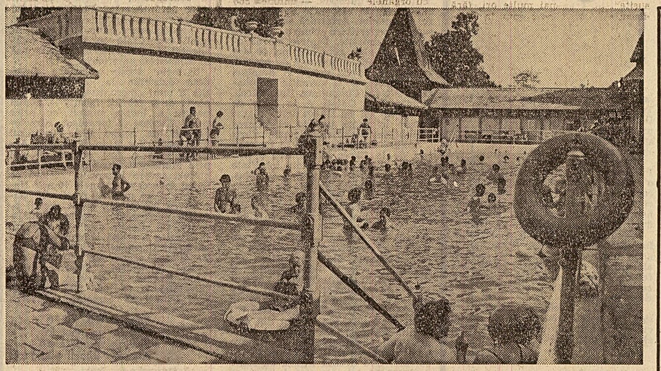
În hain sezon la Băile Felix