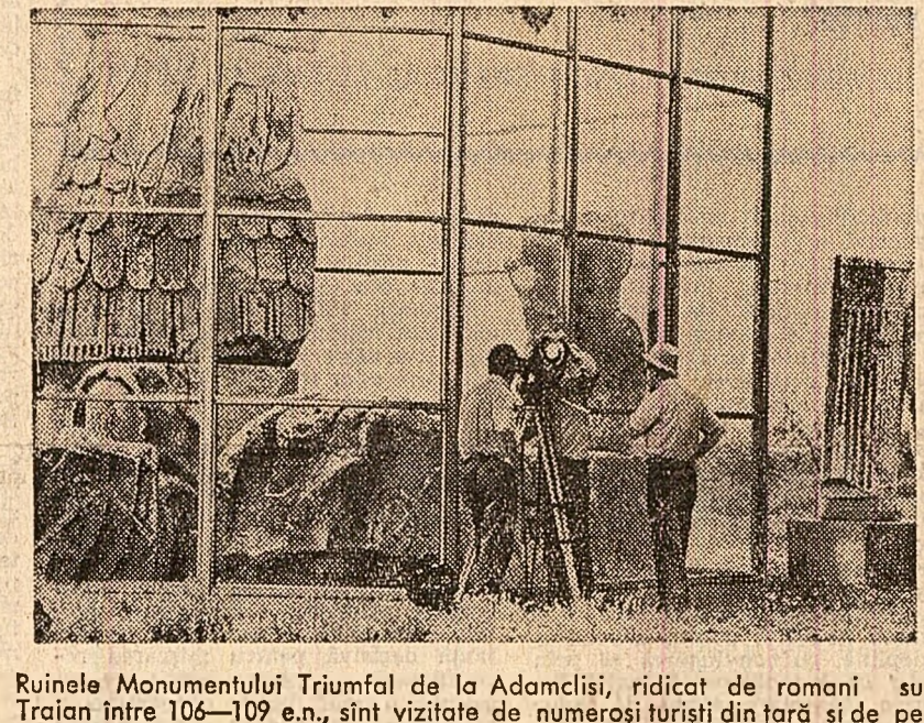
Ruinele Monumentului Triumfal de la Adamclisi, ridicat de romanii sub Traian între 106-109 e.n., sint vizitate de numeroși turiști din țară și de peste hotare

Rezultatele obținute până în prezent arată că în centrul universitar Iași există toate premisele pentru perfecționarea și modernizarea învățământului superior, precondiții de conducere a partidului și statului nostru, cerută de impetuoasa dezvoltare a economiei și culturii socialiste, de înflorirea societății noastre, de progresul contemporan al științei și tehnicii. Măsurile adoptate și altele ce se vor lua în acest domeniu vor asigura o mai bună pregătire și educare a tineretului studențesc, sporind aportul școlii noastre superioare la ridicarea nivelului de cultură al întregului popor.