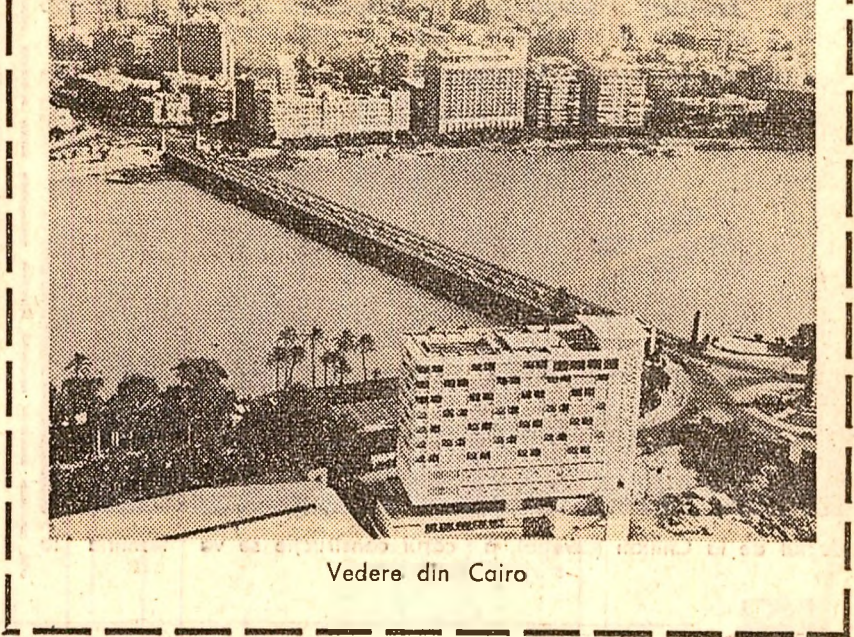
Vedere din Cairo