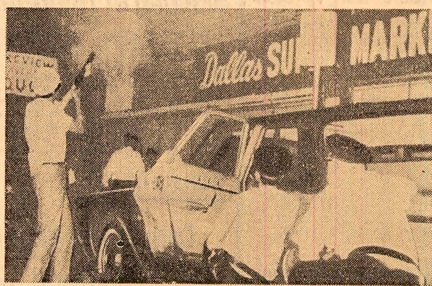
Incidente izbucnute marți seara în orașul Cleveland (statul Ohio) au continuat în cursul zilei de miercuri. Schimbul de focuri între negri și poliție a făcut pînă în prezent 10 victime, dintre care trei polițiști. Alte 18 persoane au fost rănite. Guvernatorul statului Ohio, James Rhodes, a ordonat mobilizarea a 15.000 de membri ai găzii naționale, care au folosit vehicule blindate împotriva grupurilor de negri. Situația din oraș continuă să se mențină încordată.