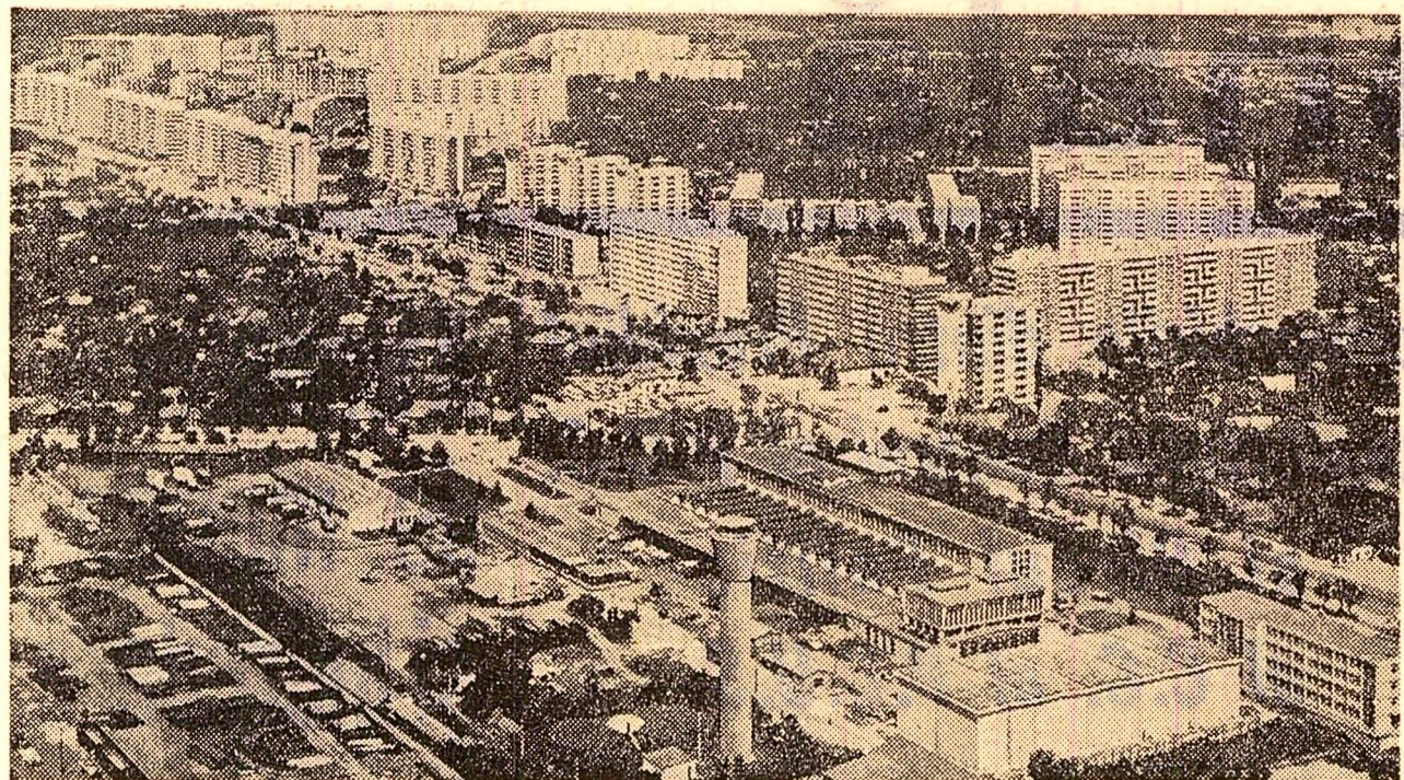
Un nou peisaj al cartierului Militari din Capitală