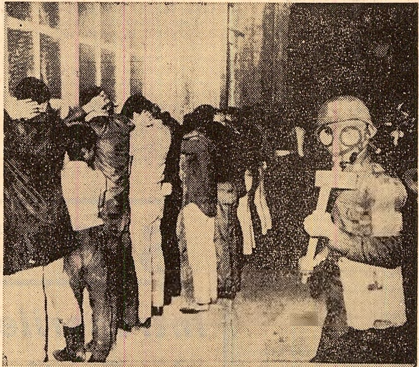
Purind mști de gaze și bastoane, soldații îi păzesc pe studenții arestați în timpul ciocnirilor care au avut loc la Mexico City

BAGDAD 31 (Agerpres). — Agenția Franco Presse transmite, citind agenția M.E.N., că la Bagdad au fost adoptate măsuri de securitate excepționale, o dată cu hotărârea președintelui Ahmed Hassan Al-Bakr de a dizolva cabinetul și de a exclude din Consiliul comandamentului revoluției pe fostul premier, Abdol Razzak Al-Nayef, și pe fostul ministru al apărării, Abdel Rahman Al-Daoud. În jurul palatului prezidențial, al clădirilor radiodifuziunii și ministerului apărării au fost postate unități de blindate. Au fost marcate, de asemenea, trupe și în alte puncte strategice ale capitalei. Președintele Republicii Irak, generalul Ahmed Hassan Al-Bakr, va deține și funcția de prim-ministru — informează un comunicat difuzat de postul de radio Bagdad.