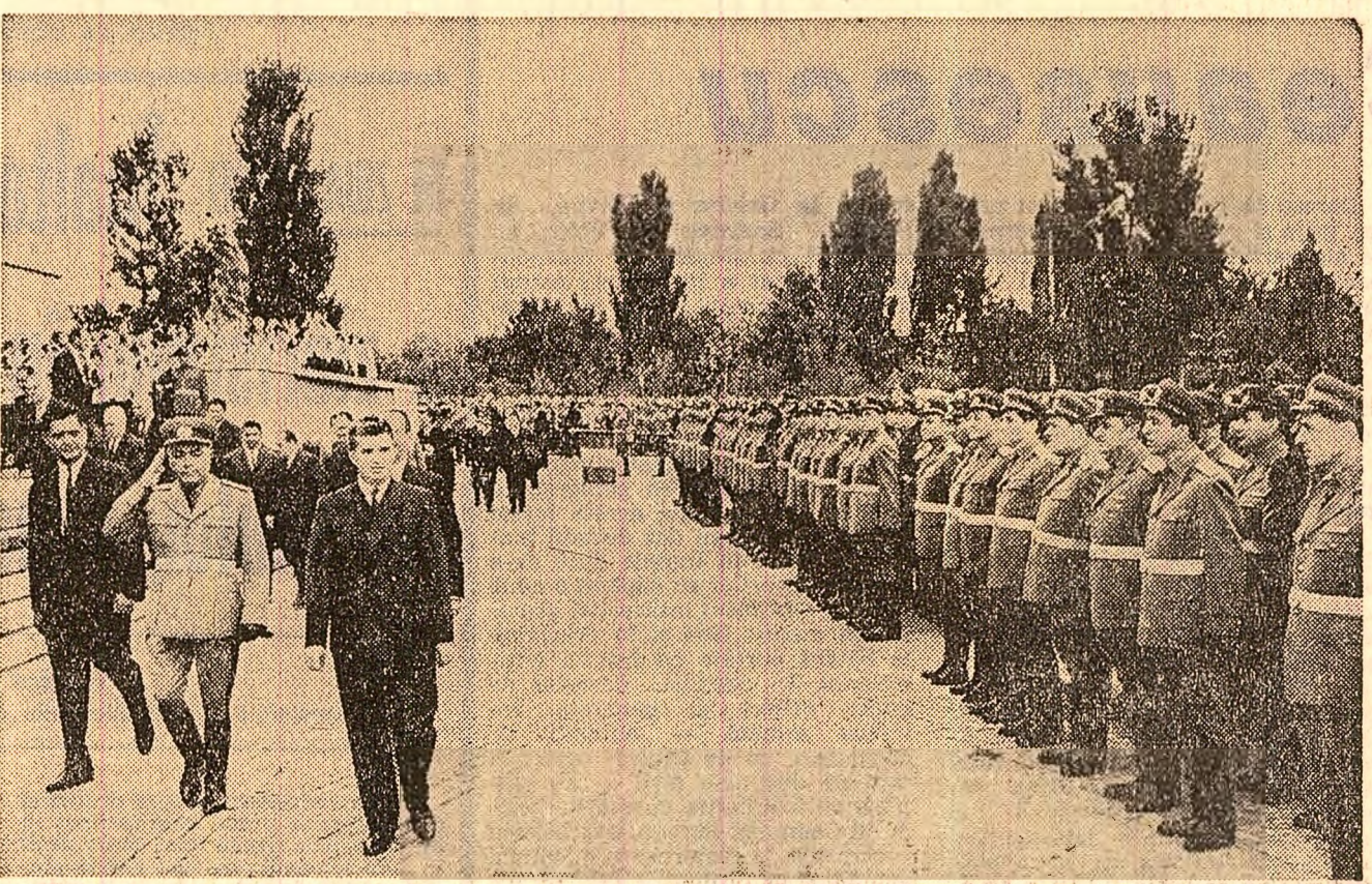
Tovarășul Nicolae Ceaușescu trece în revistă batalioanele de ofițeri absolvenți

Știm că sarcinile pe care le avem de îndeplinit sînt complexe, punînd în fața noastră dezideratul îmbogățirii permanente a orizontului de cunoștințe politico-ideologice, militare și de specialitate. De aceea, scoțind școala pe care am absolvit-o ca o primă treaptă în formarea noastră ca ofițeri, ne vom strădui să studiem în continuare cu perseverență, să fim recitativi față de nou, să ne al-