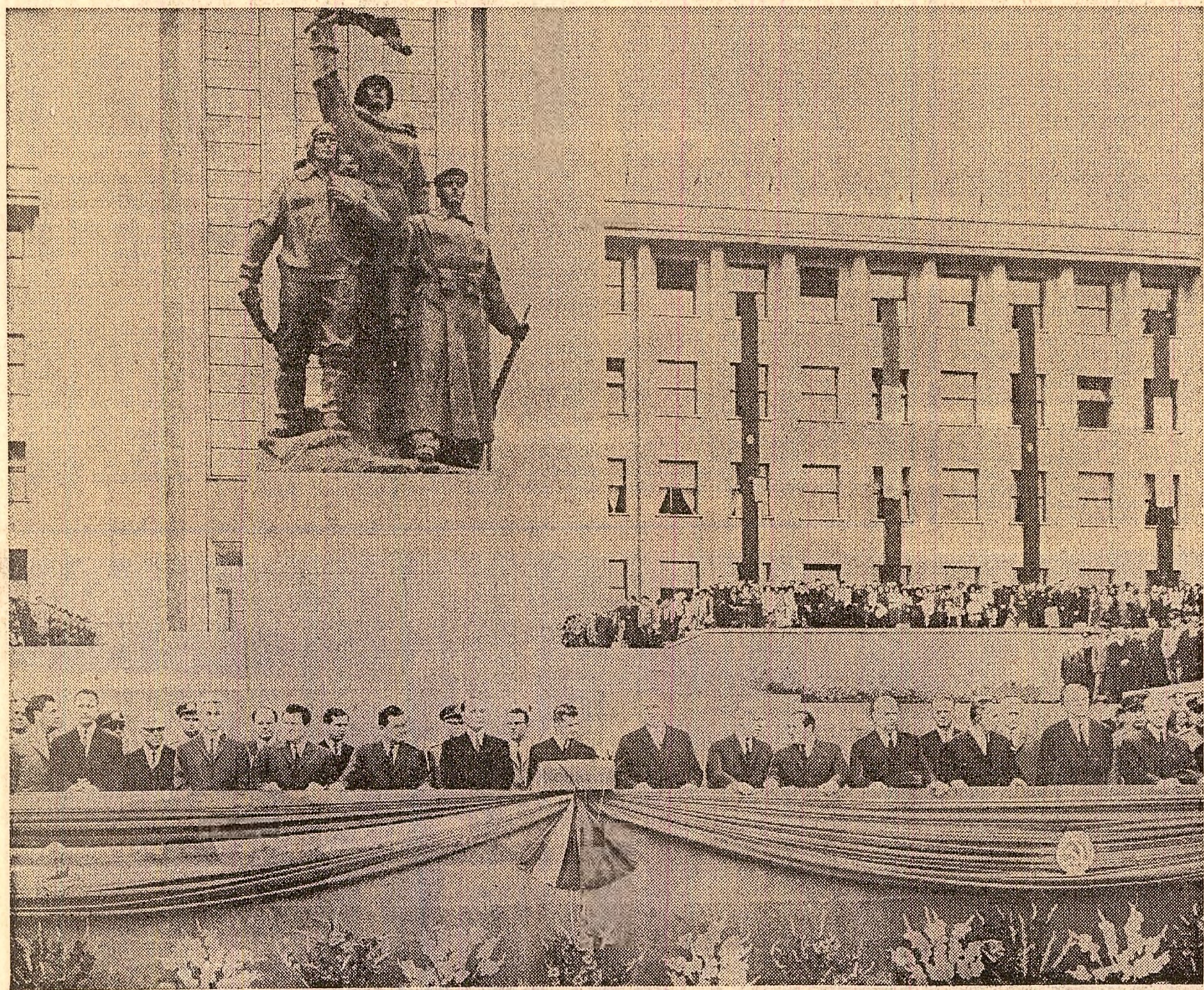
La tribuna oficială din fața Academiei Militare Generale

NICOLAE CEAUȘESCU Președintele Consiliului de Stat al Republicii Socialiste Romînia