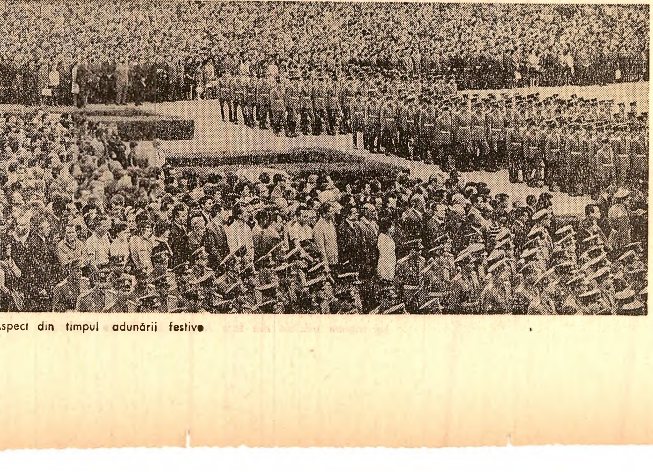
Aspect din timpul adunării festive

În 1948 realizasem o compoziție cu brigadierii și mînieri. Îmi dădeam seama că astăzi, pentru a surprinde măcar o mică parte din efortul uman care se consumase aici, pentru a surprinde istoria care se desfășurase cu atîta prezență, Văii Jiului — pentru a fi redată în adevărată ei dimensiune fizică și spirituală — li sînt necesari pereti înșeni pe care să se înscrie compoziții ample de artă monumentală care să surprindă semnificațiile perene ale epocii și evenimentelor, monumente care să înfruncheze cu clarviziune și măiestrie acest imens efort colectiv spre civilizație. Desigur, acest lucru se realizează cu efort. Dar pentru a da măsura exactă a măreției locurilor și oamenilor ei trebuie făcut.