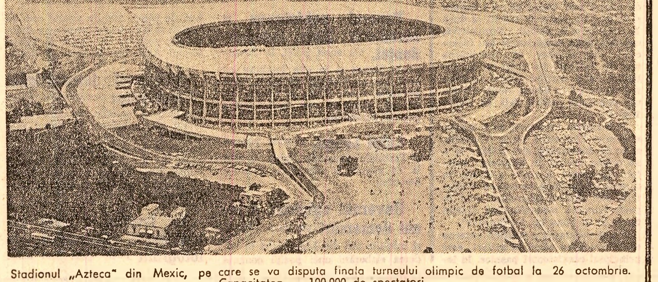
Stadionul „Azteca“ din Mexic, pe care se va disputa finala turneului olimpic de fotbal la 26 octombrie. Capacitatea - 100 000 de spectatori

Astăzi, la Brașov, începe un interesant turneu internațional masculin de volei cu participarea echipei României (două formații) Ungarești, Iugoslavi și Polonezi.