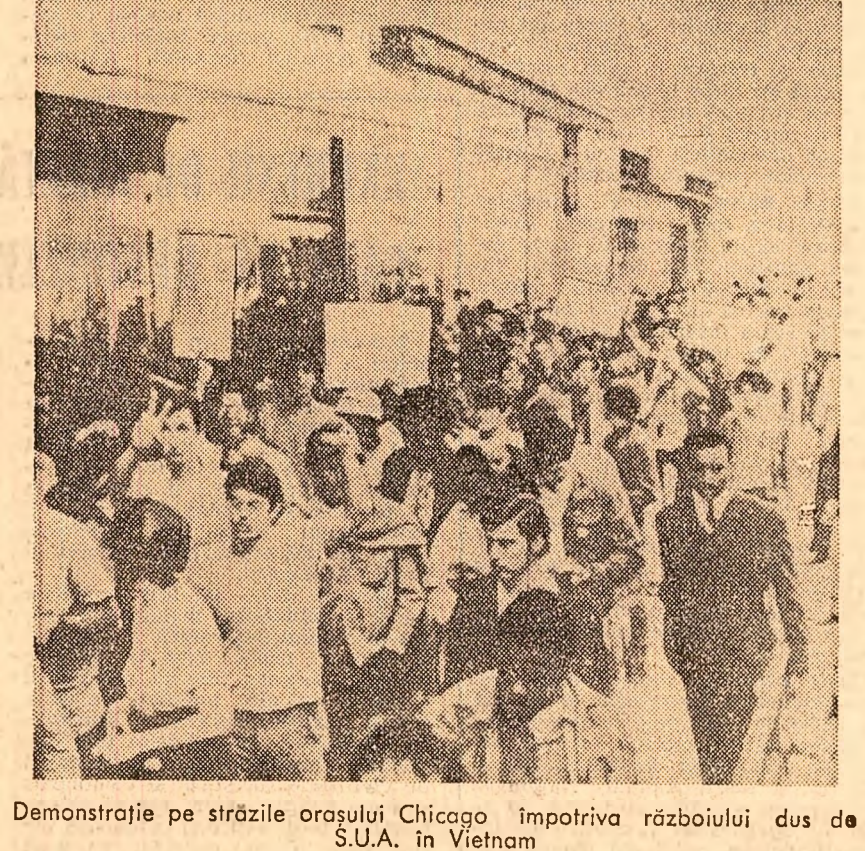
Demonstrație pe străzile orașului Chicago împotriva războiului dus de S.U.A. în Vietnam