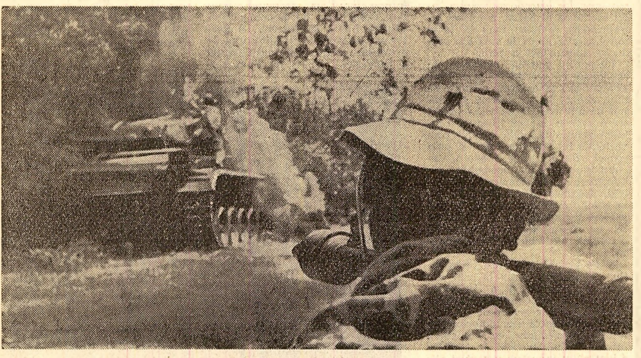
Patrioți sud-vietnamezi atacînd cu mortiere un tanc american în zona Trung-Bô