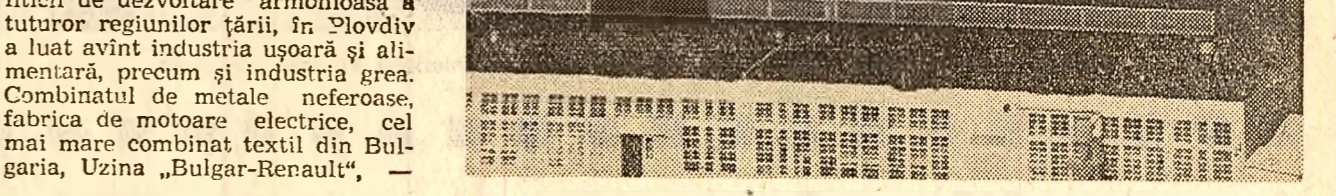
Vedere de ansamblu a combinatului petrochimic de la Burgas