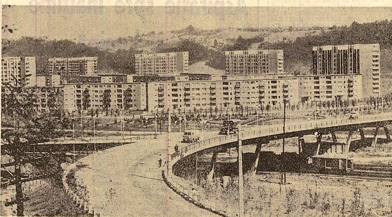
Reșița. Blocuri de locuințe în lunca Bîrzavei