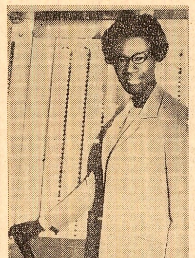
Shirley Chisholm, prima femeie de culoare aleasă la 5 noiembrie membră a Congresului S.U.A.

Televiziunea elvețiană a prezentat expoziția românească într-o emisiune specială.