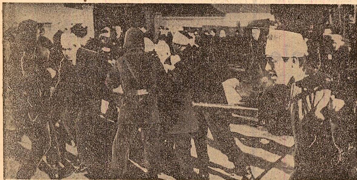
În timpul unui miting organizat de muncitorii mineri sud-coreeni, împotriva guvernului marionetă de la Seul și a sprijinitorilor săi americani, poliția a intervenit cu brutalitate încercând să-i împrăștie pe manifestanți