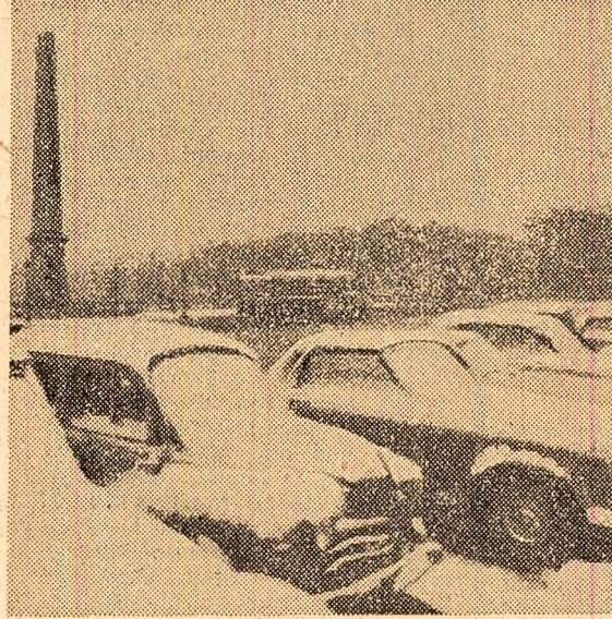
Ca și în alte capitale ale Europei, la Paris iarna și-a făcut simțită timpuriu prezența. În imagine, mașini acoperite de primăvară în piața Concorde

Puternic incendiu la Glasgow. Scoția a cunoscut la 18 noiembrie una din cele mai grave tragedii din ultimii ani. Un puternic incendiu, izbucnit la unul din interzisele docurilor din Glasgow, s-a soldat cu moartea a 24 de persoane care nu au mai putut părăsi interiorul imobilului căzut pradă flăcărilor.