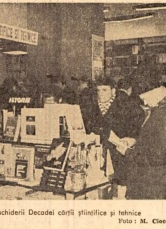
În ziua deschiderii Decadei cărții științifice și tehnice.

Ieri, la librăria „Mihail Eminescu” din Capitală, a-a deschis Decada cărții științifice și tehnice în cadrul acestei manifestări, vor fi organizate expoziții și acțiuni de difuzare a cărții la Uzinele „23 August”, „Grivița Rosie”, „Auto-terma”, „Energia”, „Vulcan”, „Vulcan”, Institutul de proiectare al industriei în soare, Institutul „Proiect” București și în alte întreprinderi și instituții din Capitală. Expoziții asemănătoare se vor organiza și la librăria „Mihail Sadoveanu”, Academiei, Librăria nr. 4 și altele.