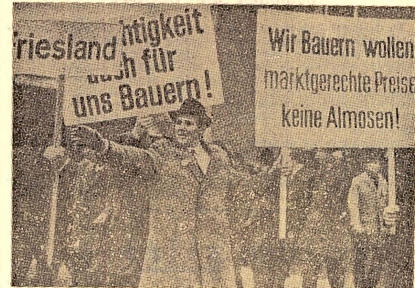
La Oldenburg (R.F.G.), sute de țărani au manifestat împotriva politicii agrare a guvernului federal, care are urmări grele pentru gospodăriile mici și mijlocii

Colocviu economic franco-român PARIS 25. — Corespondențul Agerpres Georges Dascal transmite: Colocviul franco-român pe tema „Noi forme ale comerțului internațional și cooperării între națiuni” a fost deschis oficial luni dimineață la Colegiul de France, Colocviul, la care participă cunoscuți economiști români și francezi, va dura până la 29 noiembrie. El este organizat, sub înaltul patronaj al miniștrilor afacerilor străine și educației naționale ale Franței, de către Institutul de științe economice aplicate, cu concursul Centrului de studii de politică externă, Facultății de drept și științe economice și delegației permanente a Republicii Socialiste România la UNESCO. Deschizind lucrările colocviului, Jean Marcel Jeanneney, ministru de stat, a subliniat importanța unei asemenea în-