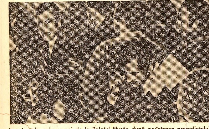
Imagine din sala presă de la Palatul Elysee după cuvîntarea președintelui de Gaulle privind situația monetară din Franța