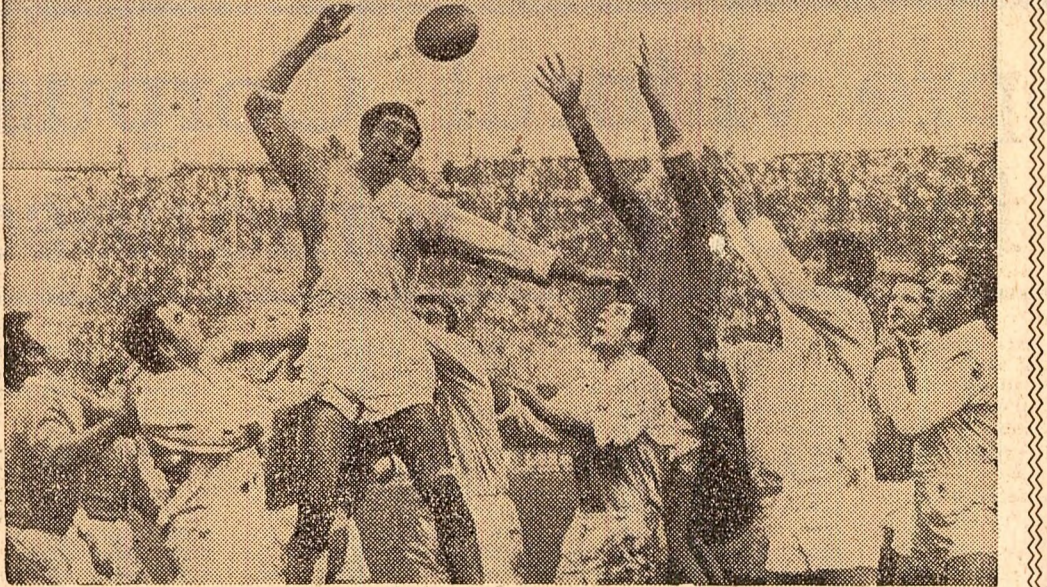
O imagine grăitoare: i-am dominat la țușă pe rugbiștii francezi!

Alte știri din țară și de peste hotare (în pag. a III-a)