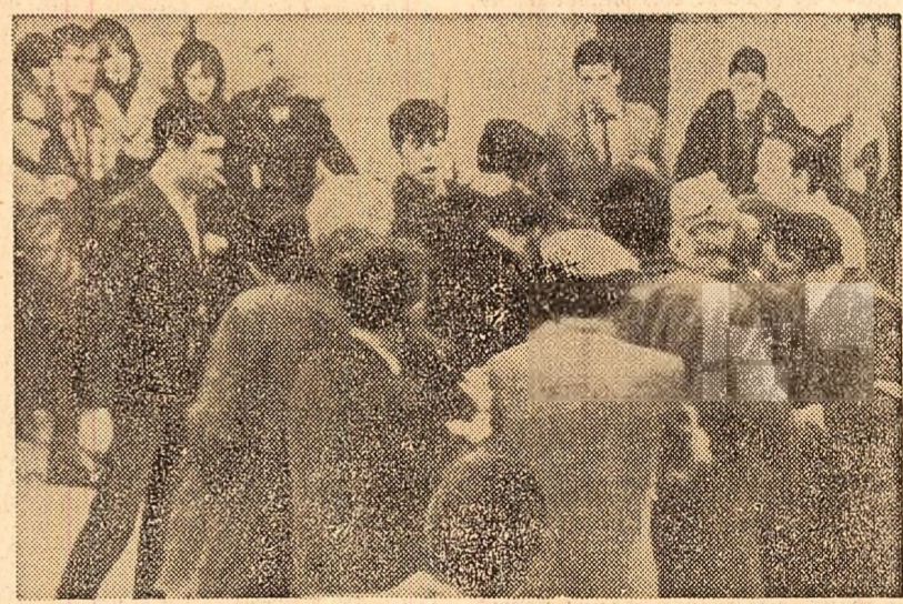
Aspect de la incidentele din Armagh (Irlanda de nord), unde au avut loc noi demonstrații pentru drepturi cetățenești

Opiniile interlocutorilor noștri relevă cu pregnanță dimensiunile problemei în discuție, atât pentru țările avansate, cît mai ales pentru cele aflate în curs de dezvoltare. Mobilizarea întregului potențial uman devine o preocupare majoră a unui număr tot mai mare de state, iar în această acțiune — așa cum au arătat și recente dezbateri UNESCO de la Paris — un rol însemnat îl are extinderea pe toate planurile a cooperării internaționale.