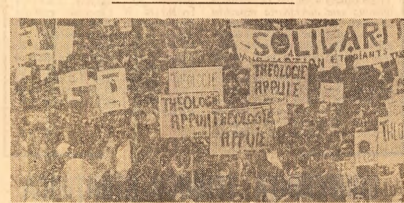
Un recent marș al studenților din Montreal (Canada), la care au participat peste 10.000 de oameni, în semn de protest față de politica guvernului în domeniul învățămîntului universitar

După cum se știe, lordul Brockway, însoțit de James Griffith, fost ministru britanic al coloniilor, a efectuat o vizită în provincia orientală din Nigeria, unde au avut convorbiri cu liderii biarezi. Surse informate declară că conducătorul guvernului federal Nigerian, Gowon, nu și-a exprimat încă poziția față de planul elaborat de comitetul parlamentar britanic.