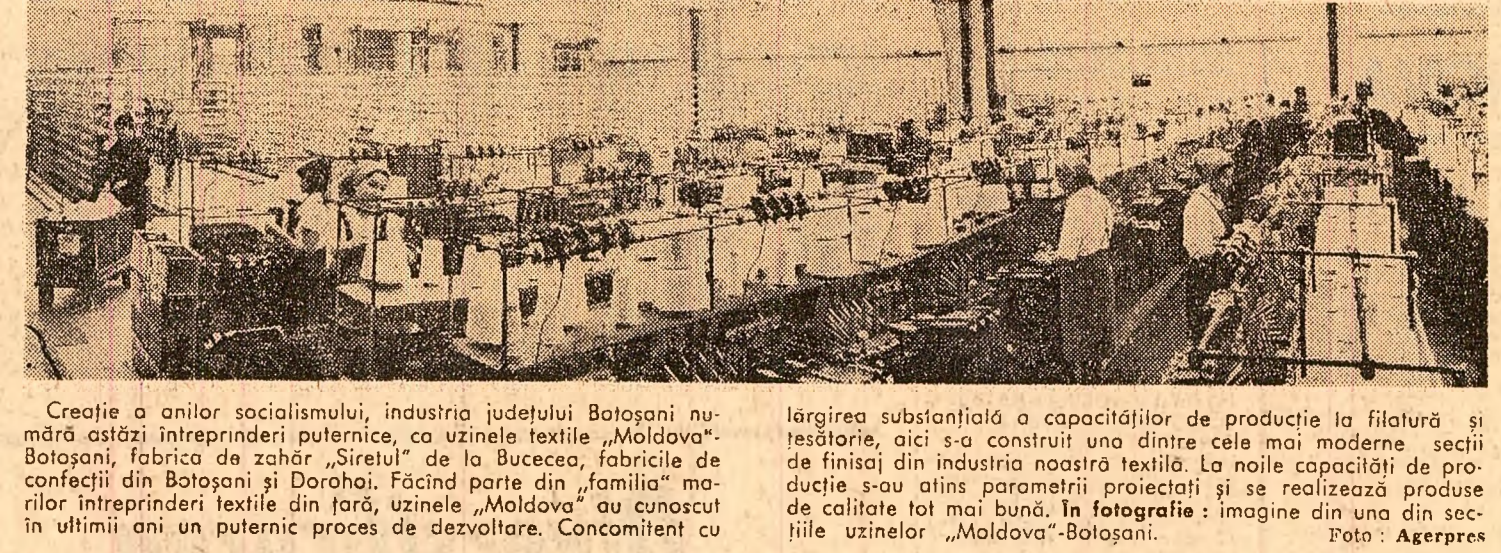
Creație a anilor socialismului, industria județului Botoșani numără astăzi întreprinderi puternice, ca uzinele textile „Moldova”-Botoșani...