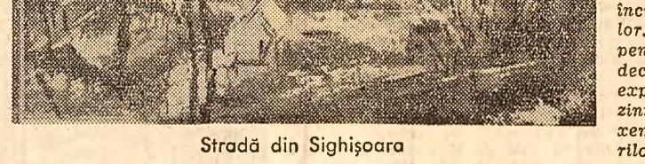
Stradă din Sighișoara