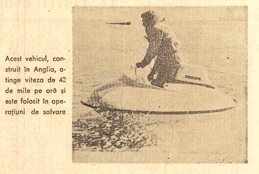
Acest vehicul, construit în Anglia, atinge viteza de 40 de mile pe oră și este folosit în operațiuni de salvare

„La Peregrina”, celebra perla descoperită în secolul al XVI-lea în golful Panama, ar fi fost cumpărată pentru suma de 37 000 dolari de actorul Richard Burton pentru a fi oferită soției sale, Liz Taylor, ca ocazie aniversării a 37 de ani. Ducele de Alba a contestat însă că perla cumpărată de Burton ar fi „La Peregrina”, care se află și astăzi în posesia fostei suverane a Spaniei. Această perla are o mărime neobișnuită, 23,8 grame. Perla oferită cadou reginei neîncononate a ccranului american este cu puțin mai mică, cîntărind 203,84 grame.