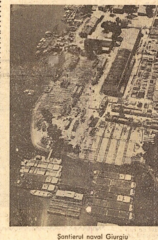
Șantierul naval Giurgiu

Giurgiu deține cîteva performanțe care jalonează, în secolul trecut, procesul de modernizare a țării. În 1854, între București și Giurgiu se inaugurează prima linie telegrafică din România. În 1869, pe același traseu, începe să circule întîia noastră trenuri (prima locomotivă de pe această primă linie poate fi văzută astăzi în Muzeul Ferate — măturile cu osebire emoționantă în acest an al centenarului cefe-rîst). Înăi nici telegraful, nici „căminul de fier” nu-au putut să provoace mutații esențiale într-o așezare care orbîndu-sea trecută în rezervă simplul rol de depozit cerealiar, de loc de tranzit al unor boabițe ce luau drumul străinătății pe un preț de nimic. Cinci-sase decenii mai târziu peisajul urbanistic înregistrase unele schimbări. Dar stagnarea ofișca lentă cîteva cetule ale economiei orașului. Vechea fabrică de zahăr — al cărei capital era deținut în proporție de peste 50 la sută de firme străine — nu oferea de lucru decât unui număr redus de muncitori; atelierele navale se limitau la simple reparații. Giurgiu mai avea, printre