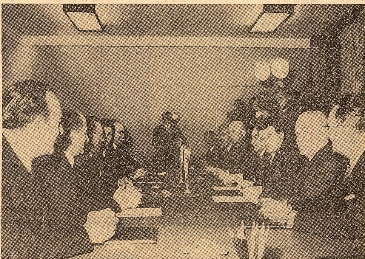
În timpul convorbirilor oficiale

La 1 februarie, la sediul Comitetului județean Timiș al P.C.R., au început convorbirile între tovarășii Nicolae Ceaușescu, secretar general al Comitetului Central al Partidului Comunist Român, președintele Consiliului de Stat al Republicii Socialiste România, și Iosip Broz Tito, președintele Republicii Socialiste Federative Iugoslavia, președintele Uniunii Comunistilor din Iugoslavia.