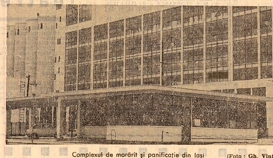
Complexul de morărit și panificație din Iași

surcursa județeană a Băncii de Investiții, rezultă că valoarea mașinilor și utilajelor care stau nefolosite însumează peste 60 milioane lei, dintre care aproape 40 milioane în întreprinderile de construcții și 21 milioane lei în industrie (de pildă, la Întreprinderea de foraj Medias, U.C.M. Copsa Mică și altele). O situație inadmisibilă, dacă ne gîndim că numai amortismentele plătite pe timpul nefolosirii acestor mijloace tehnice au ajuns în anul trecut la 3,4 milioane lei. Acești aperește este valabilă și în cazul folosirii unor capacități de producție. Numai prin neacoperirea, în perioada următoare, în primul rînd, în vederea îndeplinirii planului de investiții, comisia de specialiști din cadrul Ministerului Industriei Construcțiilor de Mașini numită să analizeze această problemă nu a sosit pînă la data amintită în județ. Nu mai vorbim de faptul că multe întreprinderi au și început să întreprindă mari greutăți din cauza slabei aprovizionări cu materii prime și materiale. Chiar în