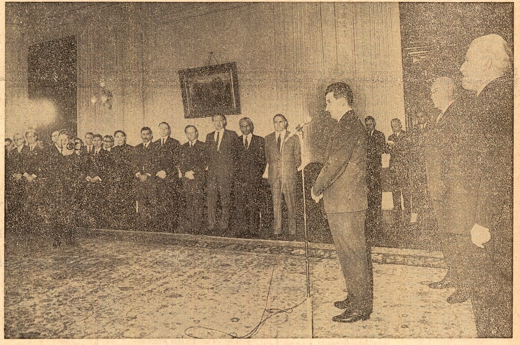
La Palatul Marii Adunări Naționale, în timpul solemnității