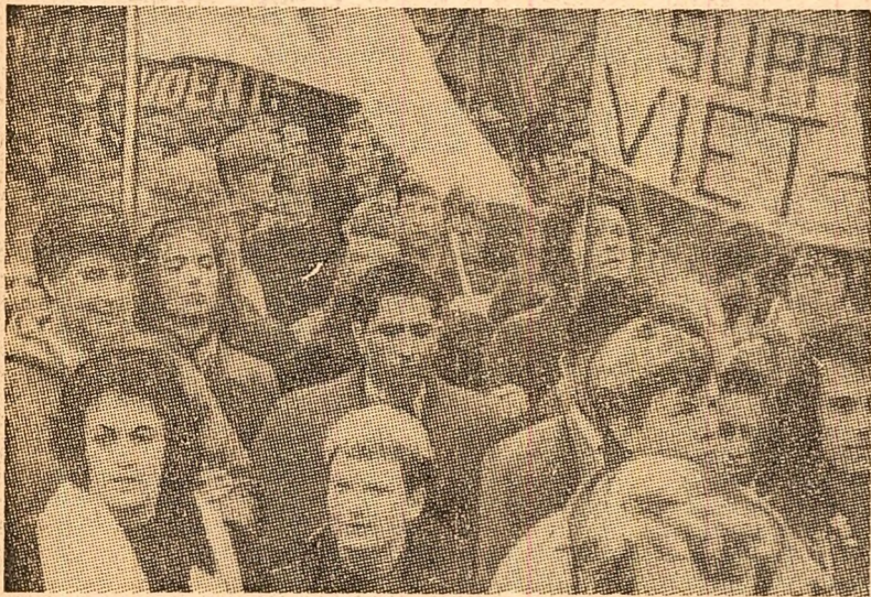
Londra. În Trafalgar Square, mii de londonezi au manifestat în sprijinul luptei eroicului popor vietnamez.