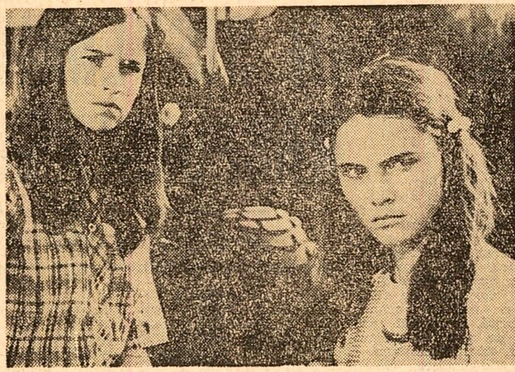
Regia: André Cayatte.

O producție a studiourilor franceze, în care apar Jacques Brel și Emmanuelle Riva.