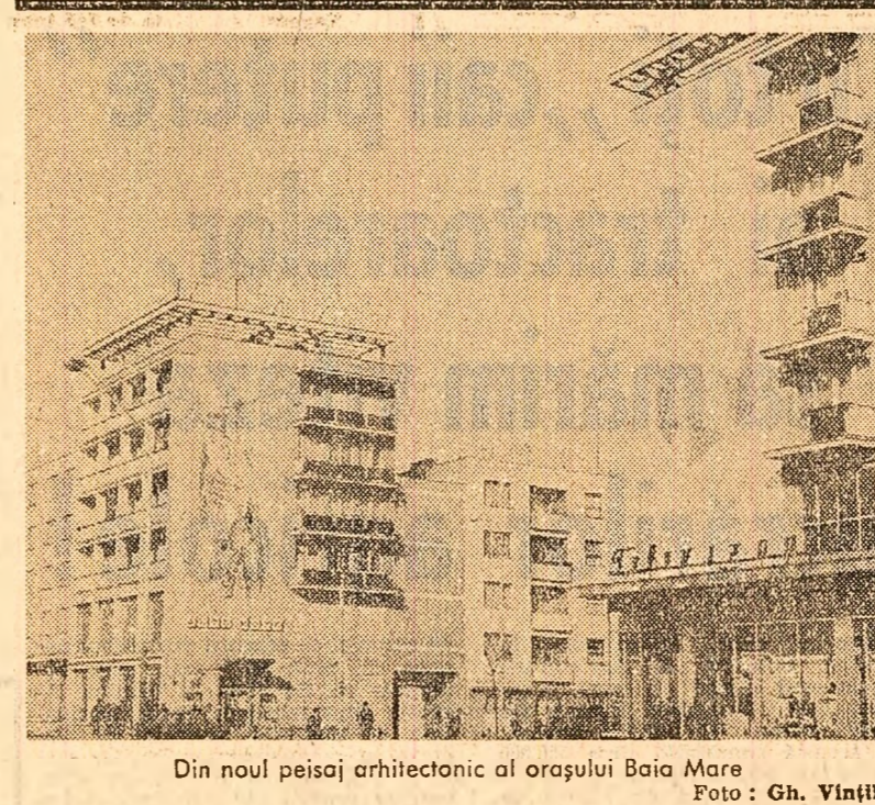
Din noul peisaj arhitectonic al orașului Baia Mare.

AI. LAIESU, AI. BRAD, Gh. BALTA, ȘI. DINICA