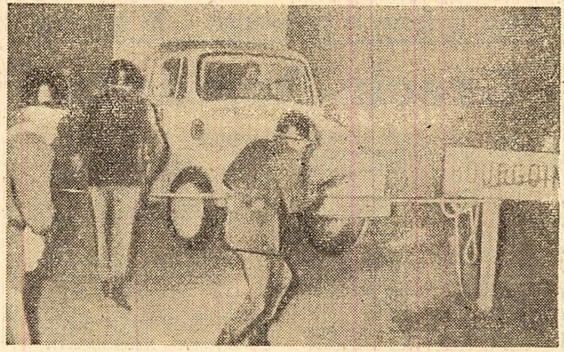
O nouă demonstrație de protest a contribuabililor francezi a avut loc la Lille, în nordul Franței. Manifestanții au blocat centrul orașului unde au demonstrat împotriva regimului fiscal și s-au solidarizat cu participanții la demonstrația de săptămâna trecută de la Bourgoin. Intre demonstrații și poliție au avut loc ciocniri violente. În fotografie: pe o stradă din Bourgoin în timpul recentelor manifestații.

— Aspirările popoarelor din lumea întreagă converg astăzi către un singur tel — asigurarea păcii, înlăturarea periculo-