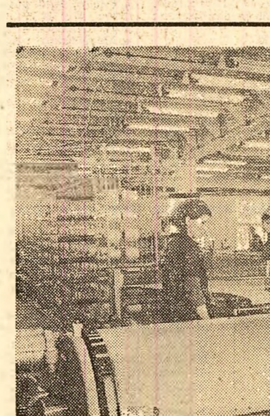
Datorită lucrărilor de dezvoltare și modernizare efectuate în ultimii ani, fabrica textilă „Independența” din Craiova și-a dublat capacitatea de producție. În fotografie: noi mașini de urzit instalate în secția preparajului.