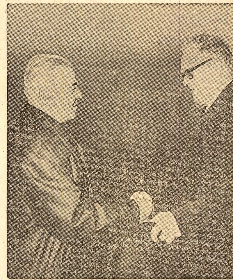
La aeroport, înainte de plecare