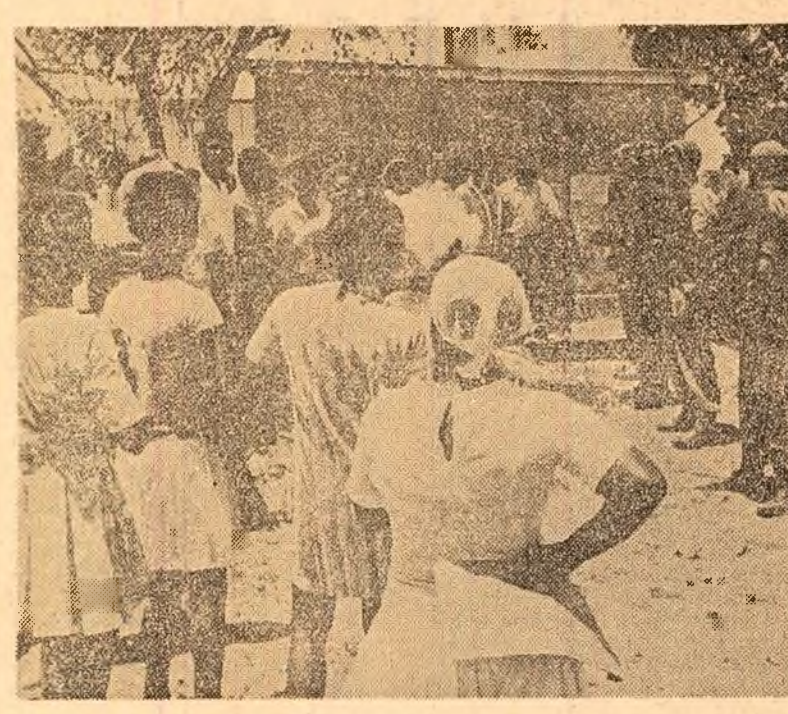
ANGUILLA. — Demonstrație a locuitorilor insulei în fața sediului comisariatului britanic, cerind retragerea trupelor de ocupație engleze

HANOI 25 (Agerpres). — Un purtător de cuvânt al Ministerului Afacerilor Externe al R. D. Vietnam a declarat că dezastrul trebuie să fie scopul principal al guvernului față de războiul din Vietnam. Administrația, a spus senatorul, trebuie să înceteze imediat toate operațiunile trupelor sale din Vietnam. O soluție pașnică a conflictului din Vietnam, a spus el, trebuie să fie realizată acum.