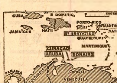
Insulele olandeze și-au instalat rafinăriile și birourile pe insule. Condițiile de muncă oferite populației indigene de companiile petroliere erau inferoare chiar celor existente în alte țări, unde petrolul este exploatat de marile companii străine. Și tocmai muncitorii de la trustul anglo-olandez „Shell” au fost cei care au dezlănțuit mișcarea grevistă din colonie. Căuza imediată o a dus la recentele tulburări a fost o manifestare a muncitorilor de la „Shell” care protestau împotriva șomajului, lipsei de locuințe și cererii condiții mai bune de muncă și de trai. Sindicatul dochtelor a fost o manifestare a muncitorilor de la uzinele metalurgice „Werkspoor” s-au declarat imediat solidari cu manifestanții, cerind demisia actualului guvern, condus de Ciro de Kroon.

Tulburările din arhipelag au strînit vîl reacții și la Haga. În fața sediului parlamentului a avut loc o demonstrație unor rezidenți antilezi care au revendicat retragerea trupelor intervenționiste din insule, organizarea de alegeri generale și acordarea independenței. Partidele de opoziție din Olanda au criticat hotărîrea guvernului de a trimite trupe la Willemstad.