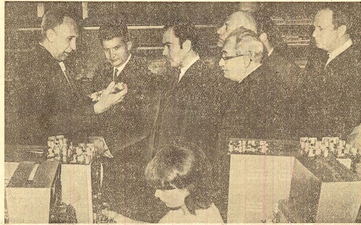
În timpul vizitei la fabrica de produse electrotehnice

Ureze din toată inima locuitorilor orașului Riga, tuturor oamenilor muncii din R.S.S. Letonă multe succese în activitatea lor, prosperitate și viață îndelungată.