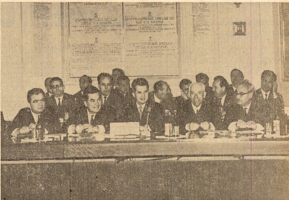
Delegația Partidului Comunist Român, condusă de tovarășul Nicolae Ceaușescu, în timpul lucrărilor conșfăturii