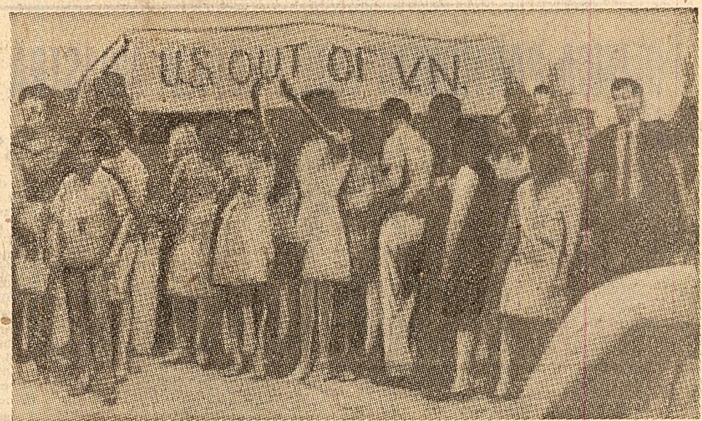
Washington. O. recentă demonstrație în fața Pentagonului sub lozincă „S.U.A. — afară din Vietnam!”

sumul total de gaze naturale din Franța. După vizitarea uzinei, membrii delegației sindicale române au avut o întâlnire cu membrii comitetului sindical al organizației C.G.T. din întreprindere. Cu acest prilej, tovarășul Gheorghe Apostol a subliniat că vizita delegației U.G.S.R. se înscrie în cadrul bunelor relații existente între sindicatele române și cele franceze și că discuțiile și contactele directe cu conducerea C.G.T., cu organizațiile sindicale din Franța, cu reprezentanții organizației sindicale din întreprindere S.N.P.A. contribuie la dezvoltarea și întărirea solidarității muncitorești internaționale. În seara aceleiași zile, delegația română s-a reîntors cu avionul la Paris.