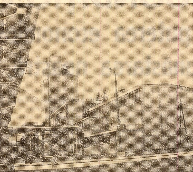
Cîștigul de eficiență, în interesul economiei naționale, dat de promovarea consecventă a celor mai noi curenturi tehnice și științifice este demn de relevat. Fabrica de acid sulfuric din Combinatul chimic Tr. Măgurela dezvoltă o productivitate a muncii de 2.770 tone pe salariat, la o investiție specifică de 800 lei pe tonă și un preț de cost de 360 lei pe tonă, în timp ce la Fabrica de acid sulfuric de la Năvodari — construită cu 10 ani în urmă — datele sînt următoarele: o productivitate de 360 tone pe salariat, o investiție specifică de 1.590 lei pe tonă și un preț de cost de 530 lei pe tonă. În fotografie: Combinatul chimic din Tr. Măgurela.

Intr-adevăr, politica de industrializare socialistă a rodit din plin în județul Satu-Mare. Cei mai în vîrstă își mai reamînesc de înnapoierea așa-zisei „industriei sîtmărene”, își amînesc, de asemenea, că în procesul inițiat de partid pentru refacerea economică a țării, muncitorii de la Uzina „Unio”, și asemenea lor mulți alții, au scos de sub ruine, acum 25 de ani, mașinile și utilajele, au încropit ateliere și au început să producă pentru popor. Acum, pe harta județului sînt înscrise peste 60 unități economice. Numai valoarea producției industriale dată peste sarcina de plan, în anul trecut, intreca de două ori întreaga producție industrială a anului 1958. Aproape că nu există întreprindere în care să nu fi avut loc, sau să nu fie în curs de realizare, un proces complex de modernizare și reutilizare tehnică, de raționalizare tehnologică, de diversificare a sortimentelor și de creșterea nivelului calitativ al acestora. „Unio”, reprezentantă pres-