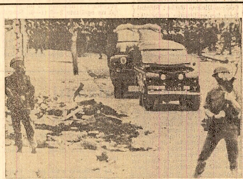
Pe străzile capitalei nord-irlandeze patrulază militari britanici, pregătiți să intervină în cazul unor noi incidente.

preună cu membrii delegației române de partid și de stat, a semnat în cartea de onoare cuvinte elogioase, subliniind valoarea exponatelor ce înfățișează sintetic și obiectiv istoria mult milenară a poporului vietnamez, străvechea sa cultură și civilizație, lupta sa eroică pentru apărarea independenței naționale împotriva agresiunii străine, împotriva colonialismului și imperialismului, pentru libertate și independență, pentru făurirea unui viitor strălucit.