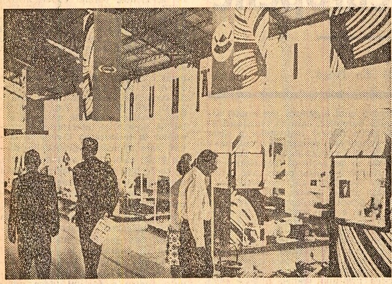
Vizitatori în fața standurilor prezentate de întreprinderile de comerț exterior ale țării noastre la Tîrgul internațional de la Brno

Premierul nord-irlandez, James Chichester-Clark, a adresat populației din Belfast apelul de a înălța imediat baricadele ridicate de cele două comunități în conflict. El a anunțat că în caz contrar, trupele britanice vor trece la înălturarea tuturor acestor baricade, în scopul restabilirii ordinii. Totodată, Chichester-Clark și-a anunțat intenția de a demisiona din funcția de prim-ministru în cazul în care nu va fi pus în aplicare la termenul stabilit programul de reforme anunțat după convorbirile sale cu reprezentanții guvernului britanic, program care are drept scop să acorde o serie de drepturi civile minorității catolice.