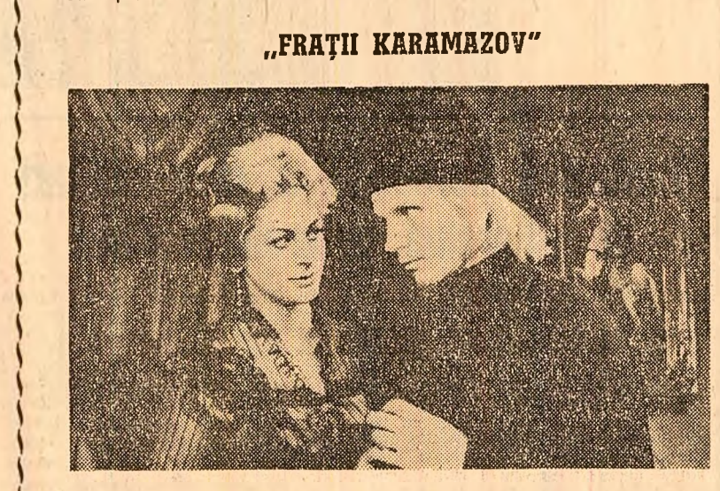
Ecranizare a celebrului roman al lui Dostoievski, în regia lui Ivan Piriiev...