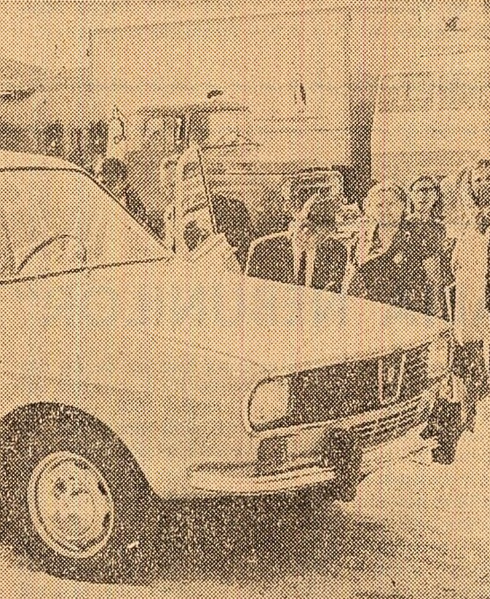
Un exemplar al „Daciei”-1300, unul din cele douăsprezece care compun așa-zisa „serie zero”