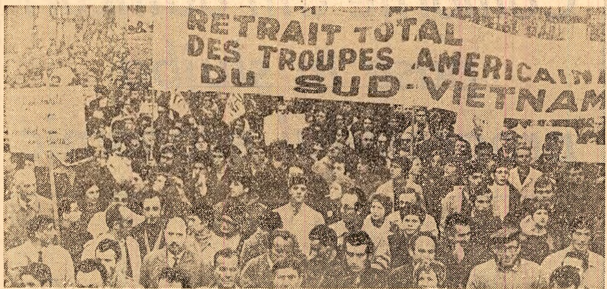
Paris. Demonstrație împotriva războiului din Vietnam