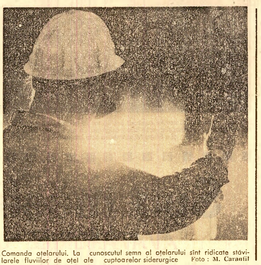
Comanda oțelului. La cunoscutul semn al oțelurilor sînt ridicate stăvilele fluviilor de oțel ale cuploarelor siderurgice.