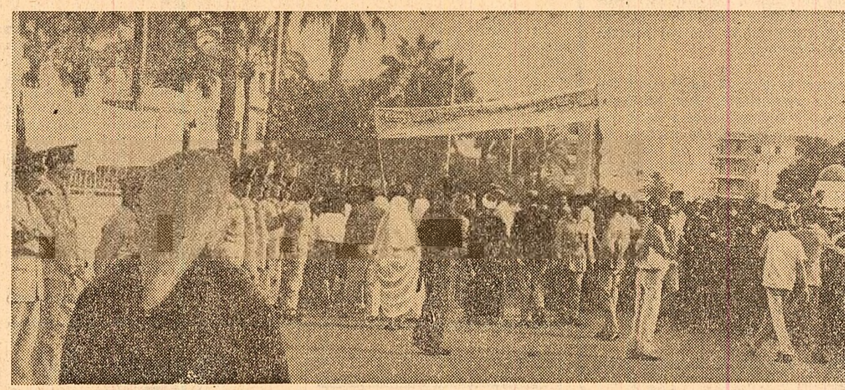
Consiliul comandamentului revoluției din Libia a creat joi un Tribunal militar în fața căruia vor fi traduși autorii încercării loviturii de stat contrarevoluționare, care a avut loc cu cîteva zile în urmă la Tripoli, anunță agenția M.E.N. Totodată, s-a anunțat că autoritățile libiene au promulgat o lege în care se prevede pedeapsa cu moartea pentru acțiunile contrarevoluționare și a proclamat, în numele poporului libian, o constituție provizorie.

SAIGON 12 (Agerpres). — După cum a anunțat agenția Eliberare, Comitetul popular revoluționar din provincia sud-vietnameză Ho Kong au hotărît să elibereze 23 de soldați ai armatei saigoneze, care au fost luați prizonieri la 2 decembrie. Un reprezentant al celor eliberați, menționează agenția, a mulțumit Frontului Național de Eliberare și Guvernului Revoluționar Provizoriu al Republicii Vietnamului de sud pentru acest act umanitar.