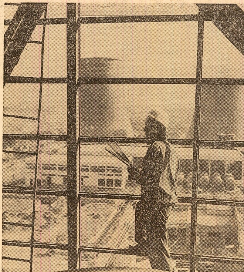
Prin intrarea în funcțiune a centralei electrice de termoficare din Constanța va fi asigurată alimentarea cu energie electrică și termică a platformei industriale de aici.

Colectivul Uzinei de produse sodice Govora și-a îndeplinit cu 21 de zile mai devreme sarcinile pe acest an la producția globală, pro-