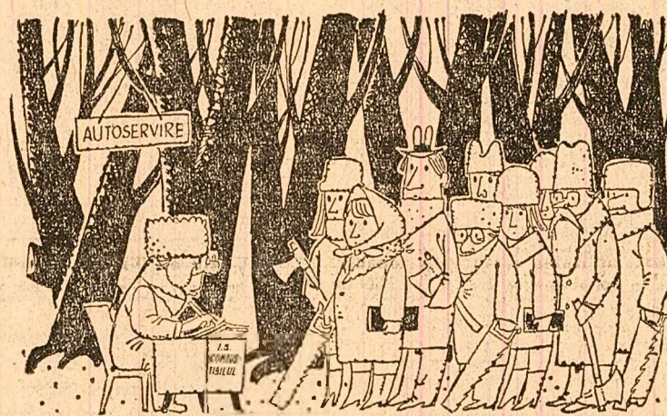
Desen de Eugen TARU

lun nou. Din acest punct de vedere, sintem vinovaţi. Dar trebuie să menţionăm că nici nu va rămîne fără lemne şi cărbuni, întrucît în calculele noastre am prevăzut cantităţi suficiente de combustibil pentru întreaga populaţie a Capitalei. Asigurăm înţeleşi necesarul pentru primele 4 luni ale iernii viitoare, după 31 octombrie 1970 vom pune la dispoziţia solicitanţilor şi cantităţi suplimentare. În afara normelor prevăzute. Ce-i drept, în unităţile noastre, cu toate că există un fond de marfă îndestulător, se mai produce întârzieri în livrarea şi expedierea comenziilor. Cauza? Fie proasta organizare a muncii, fie lipsa forţei de muncă. Sosesc zilnic sute de vagoane de lemne şi cărbuni, ce depăşesc cu mult posibilităţile noastre de descărcare. Avînd totuşi dispoziţie expresă în faţa forţelor superioare să asigurăm descărcarea neîntârziată.