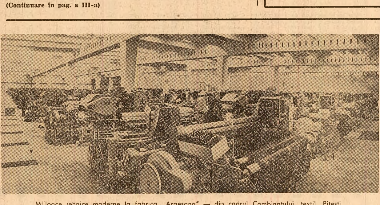
Mijloace tehnice moderne la fabrica „Argeșana” — din cadrul Combinatului textil Pitești.

În urmă cu cîteva zile ziarul nostru a inserat la rubrica „Fapt divers” relatarea unei întâmplări atît de neobișnuite, încît unora dintre cititorii lui s-a părut incredibilă. „Nu cumva s-a strecurat o eroare?” ne-a interzis telefonic un cititor. „Oare autorii acestei fapte sînt pe deplin sănătoși?” — ne-a întrebalt altul Nedumerim justificată pentru că întîmplarea pare a descinde mai curînd dintr-o piesă a teatrului absurd decît din viața și activitatea unor oameni normali. Ei bine, putem răspunde clar la ambele întrebări: 1) Nu, nu s-a strecurat nici o eroare; 2) Autorii faptei sînt, cel puțin din punctul de vedere al medicinii, pe deplin sănătoși. Atunci? Relatăm, pe scurt, datele principale ale acestei întâmplări: Miercuri, 14 ianuarie, în jurul orei 12,45, pe linia de garaj dintre stația Mogoșoia și fabrica de zahăr Chitila, o locomotivă cu o garnitură de șase vagoane de marfă, s-a ciocnit cu altă locomotivă, izolată, ce se întorcea pe aceeași linie de la o manevră. Accidentul s-a soldat cu pagube materiale destul de importante — avarierea celor două locomotive și distrugerea unui vagon de marfă — și cu rănirea unui montator a cărui însănătoșire și recuperare a capacității de muncă