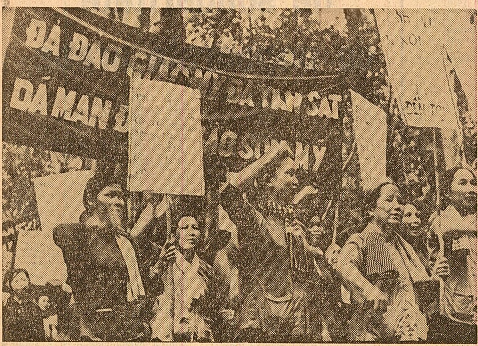
Demonstrație a populației dintr-o regiune eliberată a Vietnamului de sud împotriva masacrului săvârșit de trupele americane la Song My