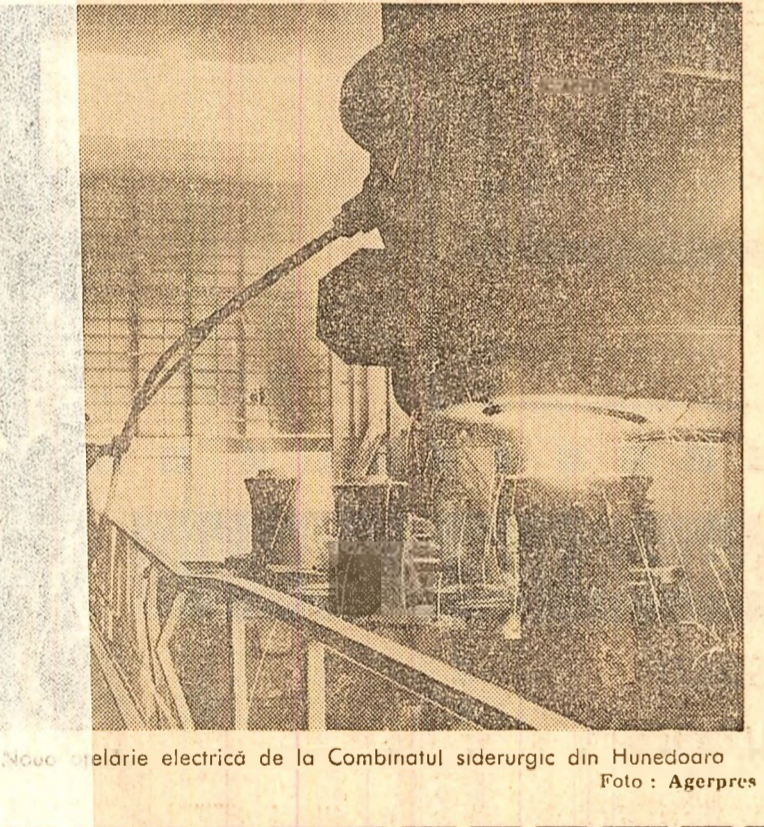
Noile celulare electrice de la Combinatul siderurgic din Hunedoara.