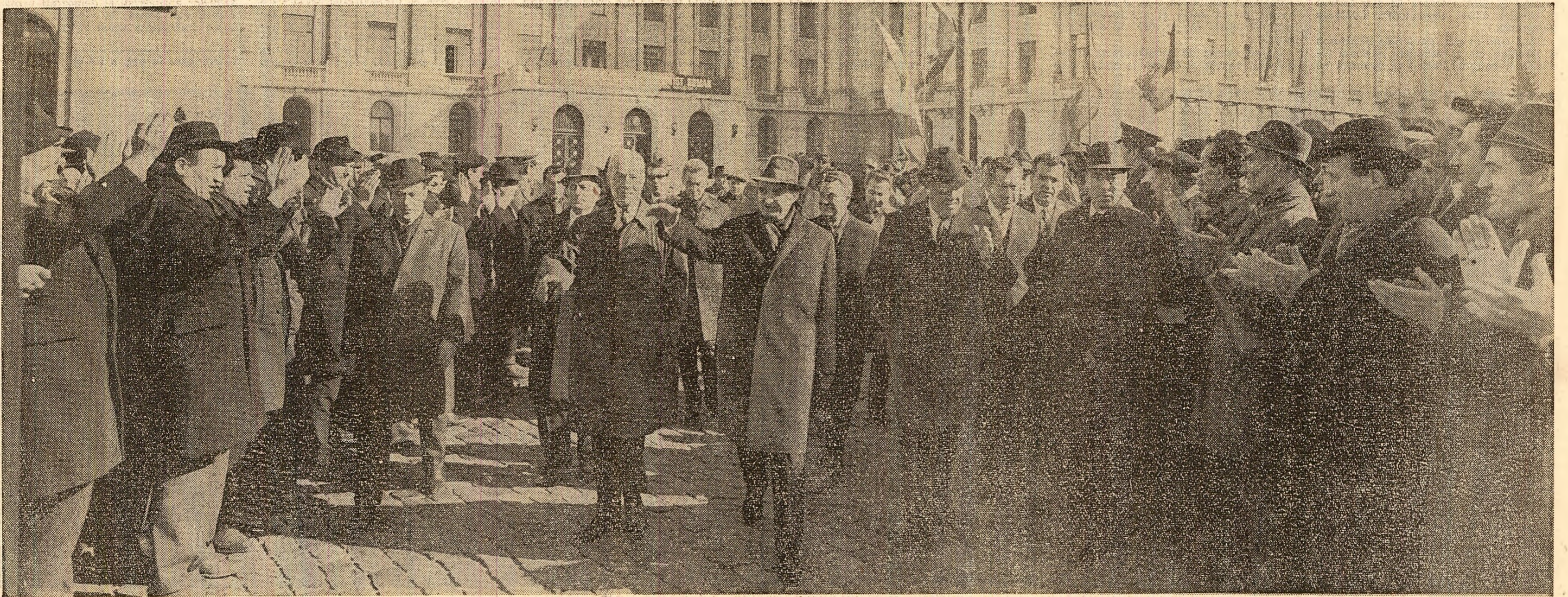
Tovarășul Nicolae Ceaușescu, împreună cu ceilalți conducători de partid și de stat, trecînd spre Sala Palatului, răspund entuziasmelor ovății și aclamațiilor ale mulțimii