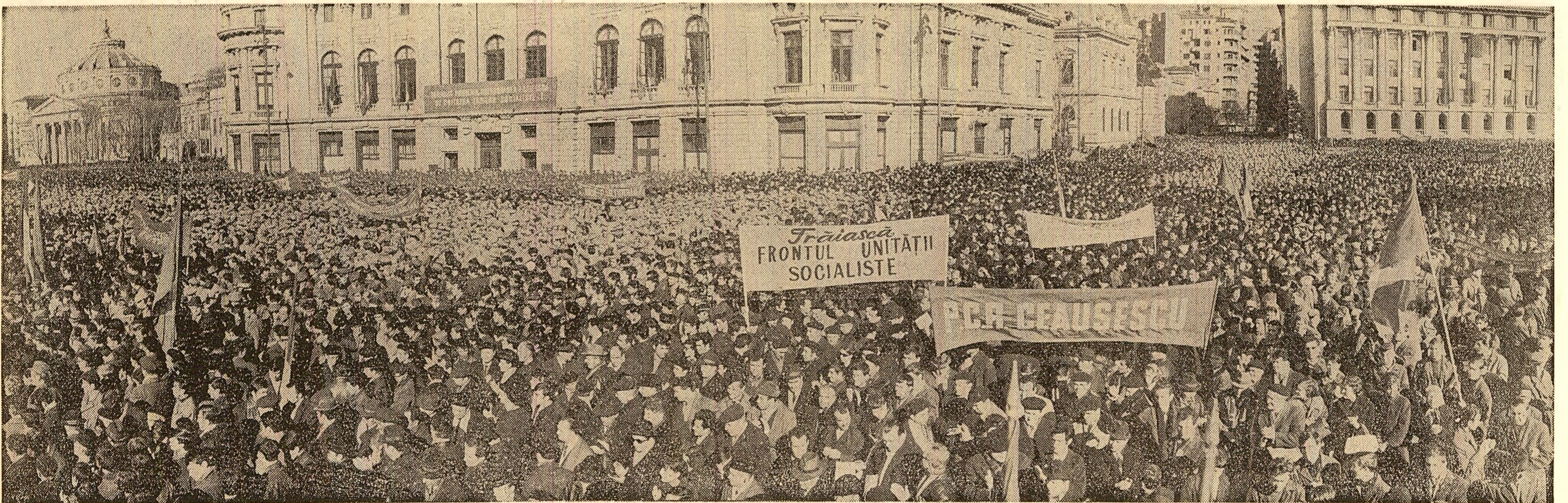
În Piața Palatului unde, acum un sfert de veac, era salutată instaurarea primului guvern democratic din istoria țării au fost prezenți, ieri, zeci de mii de bucușteni pentru a sărbători aniversarea evenimentului de la 6 Martie.