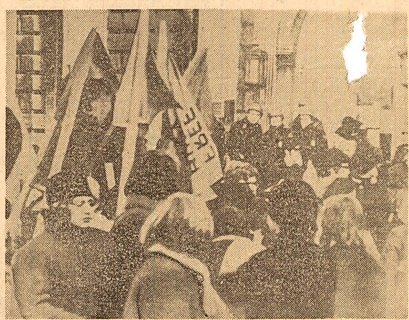
Studenții de la Centrul universitar Buffalo (Statele Unite) demonstrând importanța prezentei unor reprezentanți ai firmelor producătoare de armament în universitate. Studenții se împotrivesc pe această cale tentativelor de a-i atrage la cercetările științifice legate de realizarea unor noi tipuri de arme.