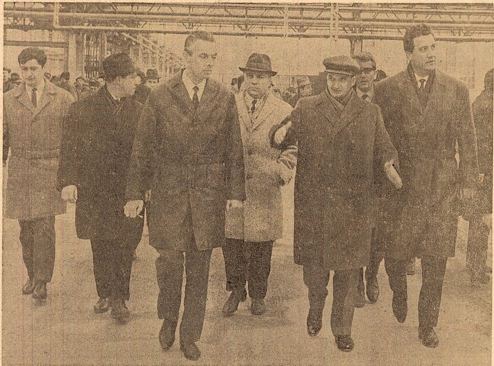
La Combinatul chimic din Rîmnicu Vîlcea

Conform proiectelor întocmite, uzina de utilaj chimic urmează să intre parțial în funcțiune în 1973, iar doi ani mai tîrziu să atingă capacitatea finală de 17.000 tone. Se