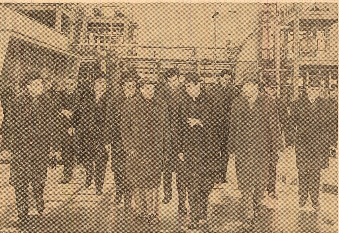
La rafinăria din Pitești

Un loc important a revenit în cadrul discuțiilor, după cum era