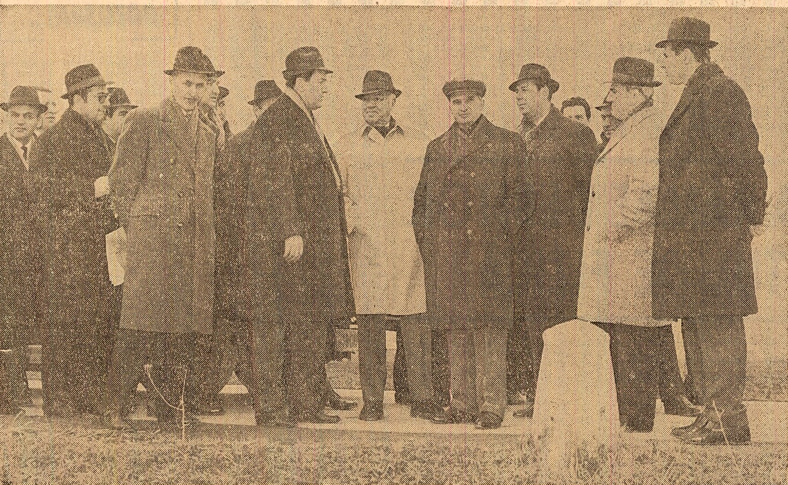
Pe locul unde va fi amplasată viitoarea uzină de utilaj chimic